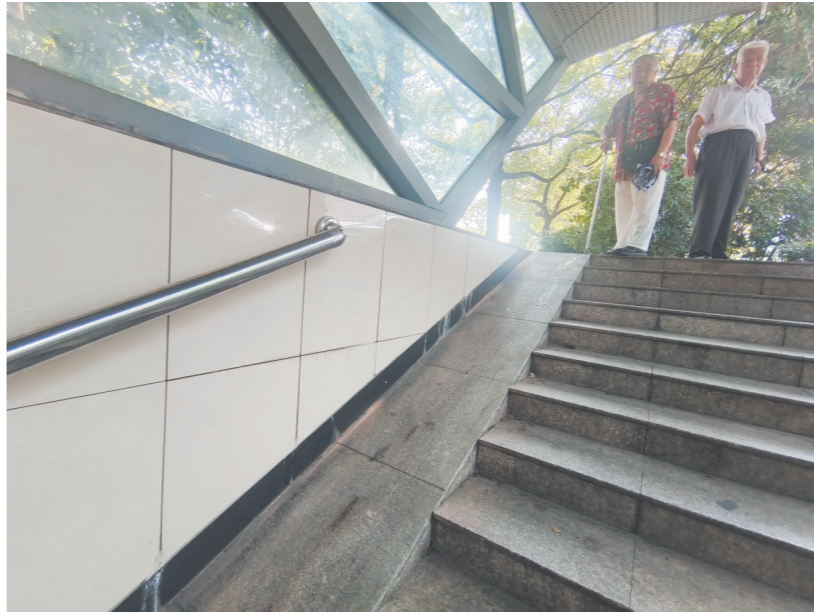
沿线其他三处地下通道，扶手安装在墙壁上，不便于行人抓握。

近日，家住天元区欣佳花园的易大爷来到报社反映这样一件事：长江北路市交通运输局至韶山路路段设有斑马线，加之沿线地下通道扶手安装不合理，这给不少老年人以及残疾人出行带来不方便。