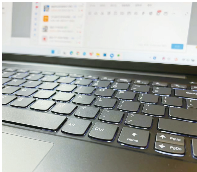
有人渴望休息，又害怕错过工作机会。

中秋小长假落幕，株洲市民投入忙碌的工作中。昨日，不少人工作首日就发出了这样的感叹：“这假期，过得比上班还累！”从工作电话和信息侵扰的非工作时间，到调休政策导致的节日时间缩短，再到假期中的各种“不放松”现象，一场关于“虚假假期”的讨论悄然兴起。今天，让我们走进市民的生活，听听他们的声音，探寻假期疲惫的真相。