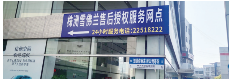
在别克4S店旁边，醒目地挂着“株洲雪佛兰售后授权服务网点”的指示牌。