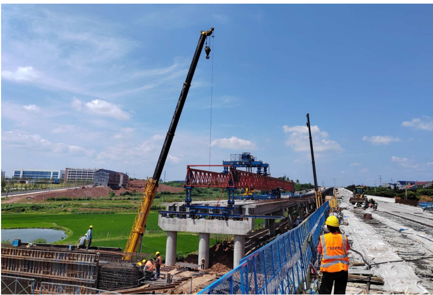
茶常高速(含安仁支线)建设现场。

展较为顺利,路基、桥涵等工程已基本完成,路面已进入第一层沥青摊铺阶段,关键控制性节点工程孟塘特大桥也