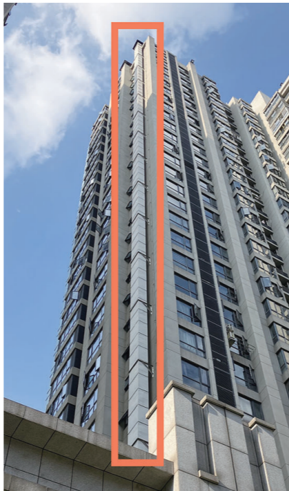
迎君原味私房菜新桂旗舰店楼上的烟道。