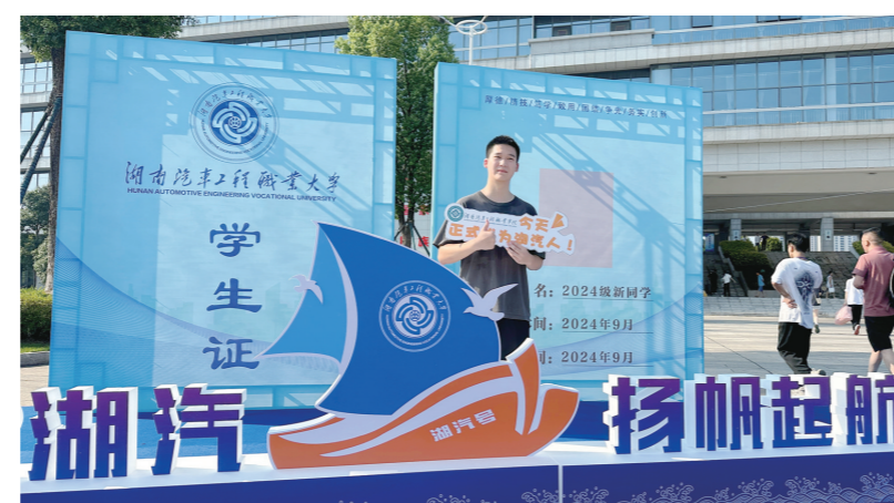
9月2日，新生在湖南汽车工程职业大学校园里合影留念。