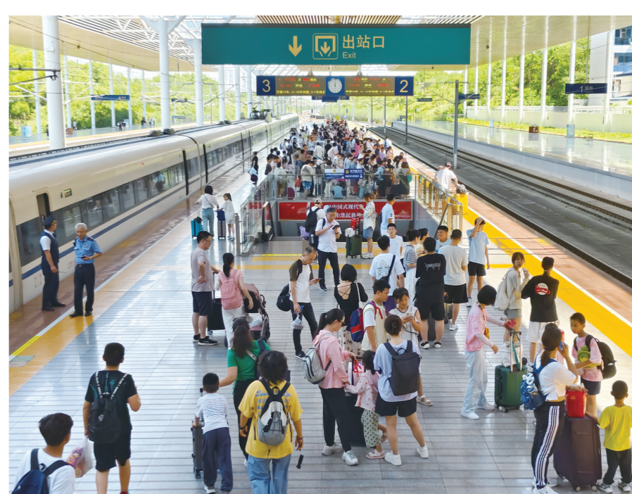
暑运期间，旅客在株洲西站候车。通讯员/包卫华 摄

株洲日报(全媒体记者/廖明 通讯员/包卫华 温馨) 9月2日，记者从株洲西站了解到，为期62天的铁路暑期运输工作已圆满收官。株洲西站旅客运输实现发送、到达双增长，运输量均超历史同期。