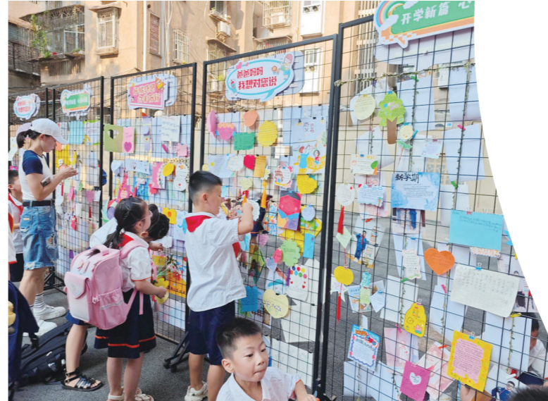
芦淞区栗树山小学,孩子动手设计制作感恩卡、心愿卡,把自己要对爸爸妈妈说的话黏贴在心愿墙上。