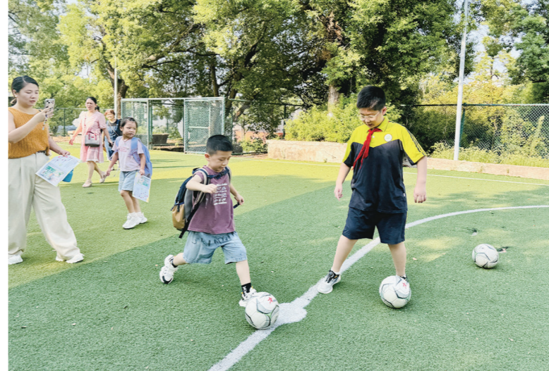
株洲六〇一中英文小学在操场、篮球场、种植园等多处精心设置了打卡集赞站点。