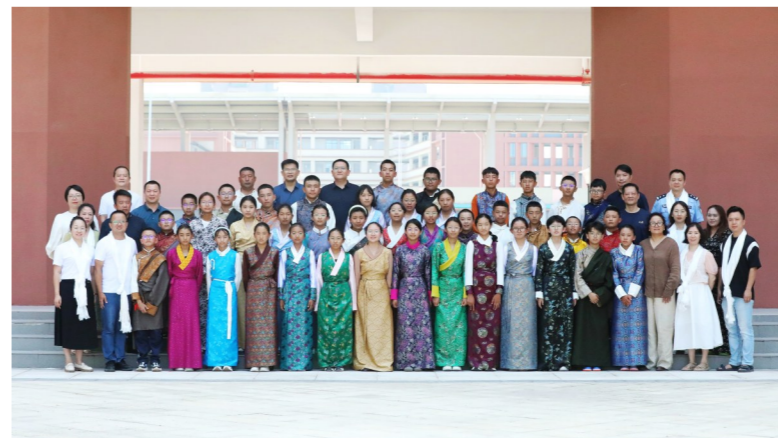
来自西藏扎囊县的初中生,穿上传统民族服装,在景炎中学开启新的学习体验。

新的学校,新的同学,新的老师,还将有新的知识。新的起点,新的追求,新的征程,还将有新的收获。在这美妙的金秋九月,同学们又一次踏上追寻美好的旅程。从此刻开始努力,立即行动起来。