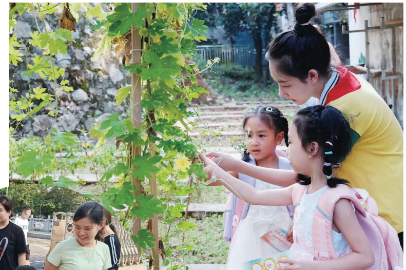
芦淞区白关中心小学作为一所乡村学校,孩子们的第一课,从田间教育开始。