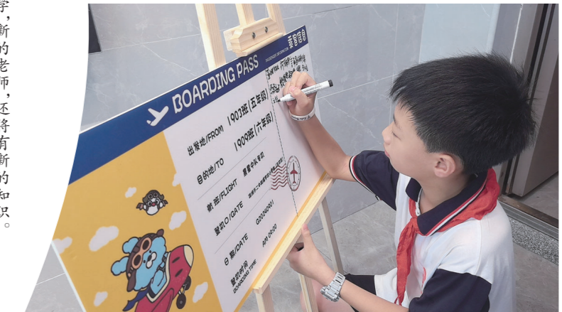
市二中枫溪学校小学部东校区的同学们,在“机票”上打卡签到。以独特的报到方式,迎接新学期的到来。