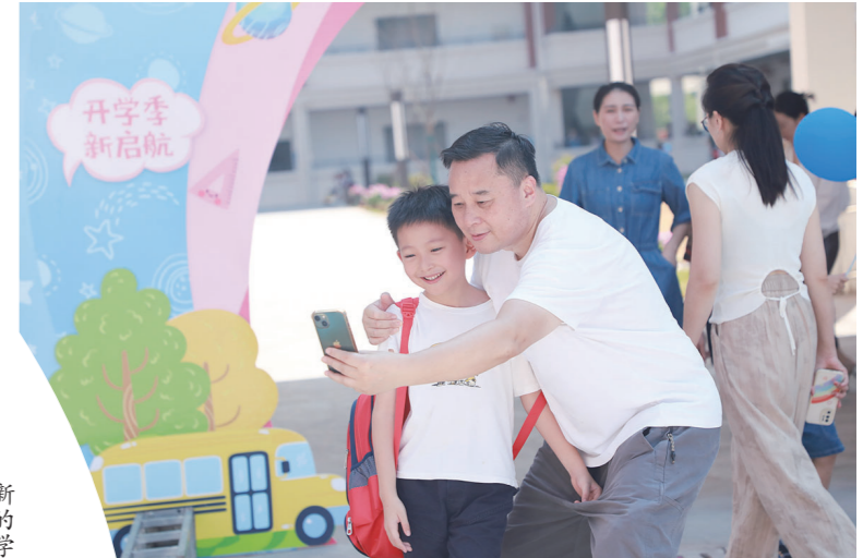
市中附小多个校区同步开学,怀揣着对知识的渴望和学习的向往,开启他们美好的新学期。校园内,家长与孩子合影留念,记录这个美好时刻。