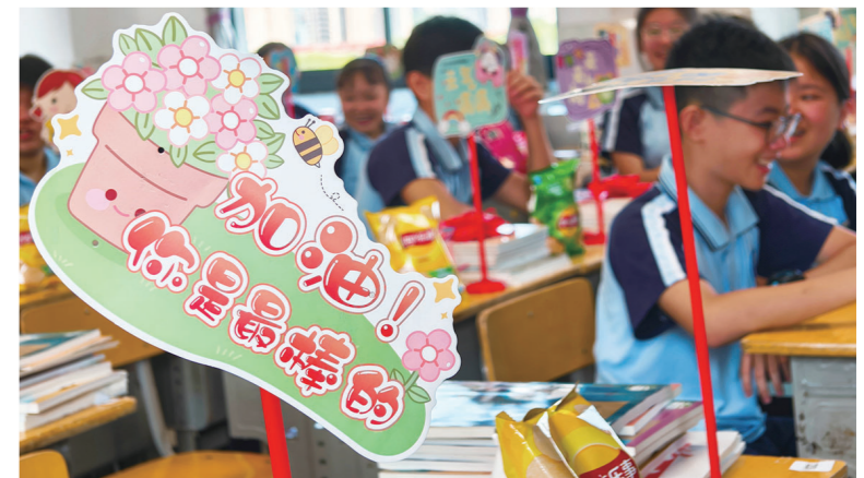
天元区建宁实验中学为学生们准备了多重开学惊喜。