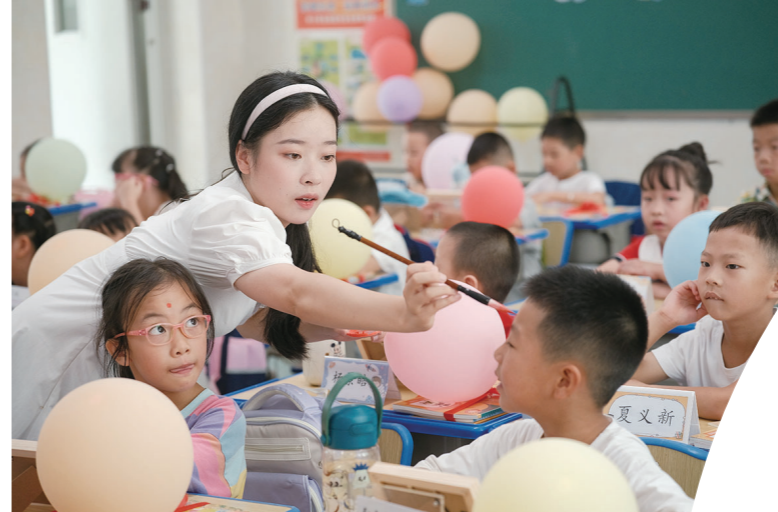
天元区隆兴小学的班主任老师在新同学的额头上点一颗朱砂,寓意眼明心亮,开启智慧之门。