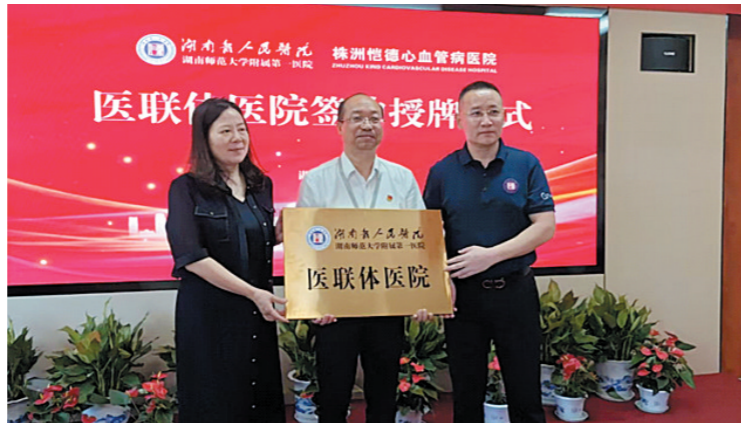
▲授牌现场。