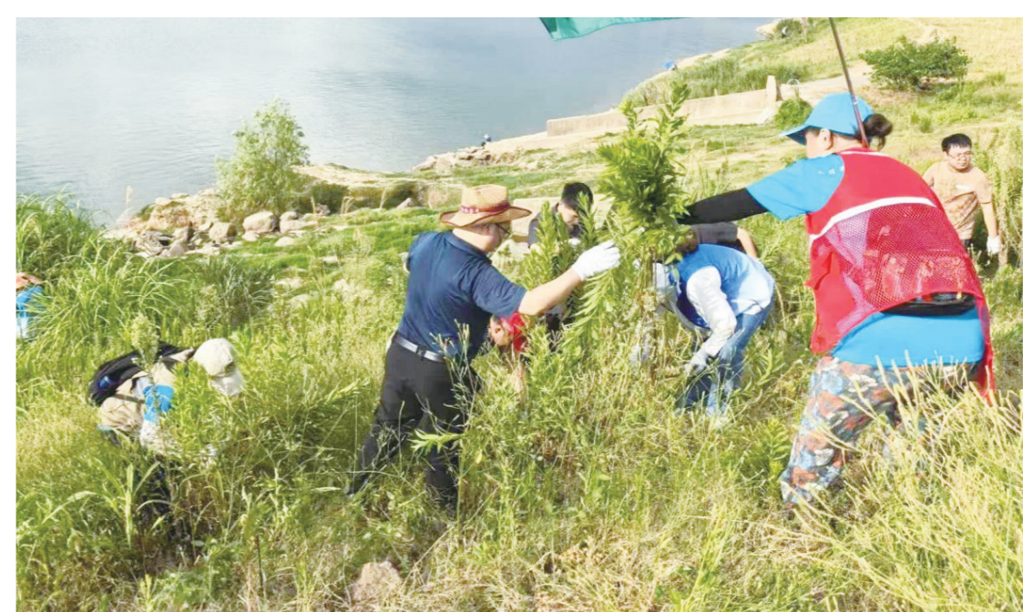
围剿加拿大一枝黄花现场。

本报讯(株洲晚报融媒体中心记者/俞强年 通讯员/李行) 时下，加拿大一枝黄花即将进入开花期。连日来，天元区多个部门联动志愿者，对加拿大一枝黄花进行合力围剿，通过切断种籽传播源，防止其扩散蔓延。