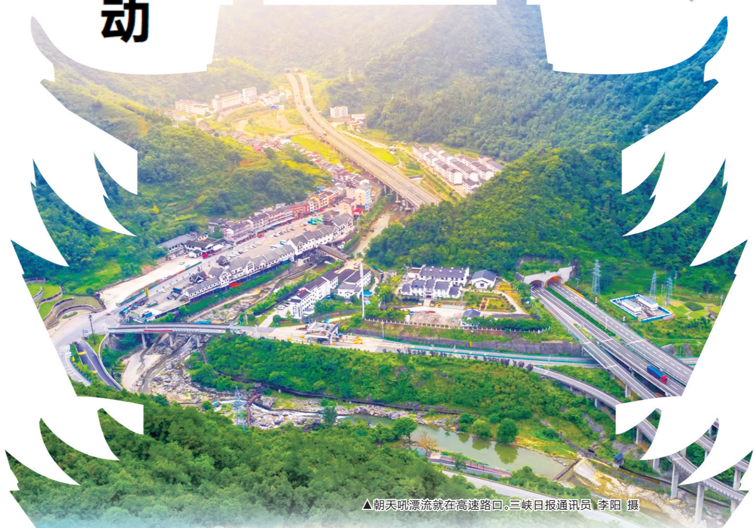
朝天吼漂流就在高速路口。

上善若水。湖北宜昌,被誉为“水城”,数百条河流奔涌于此,川流不息。数十公里长的香溪,孕育英才。伟大诗人屈原由此走出,其爱国为民情怀,求索精神历久弥新,激励着华夏儿女奋斗不止;溪边浣帕的小女孩王昭君,成长为母仪塞外的和亲使者,是民族团结的象征,至今传扬。