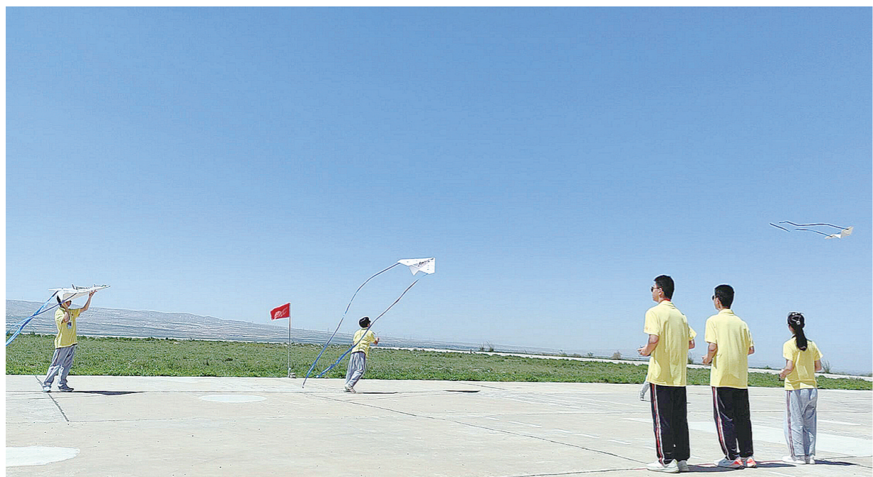
同学们在烈日下放飞纸飞机。

株洲日报讯(全媒体记者/戴凛 通讯员/刘艺琴) 日前,2024年全国青少年航空航天模型锦标赛在宁夏举行,株洲市南方中学11名学生作为湖南省队主要代表成员,凭借出色的表现,在多个比赛项目中脱颖而出,拿下13个全国性奖项,展现了该校在航空航天模型教育领域的卓越成果。