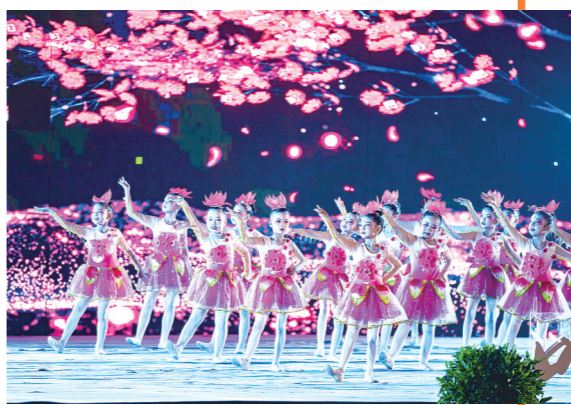
长沙市一中云龙实验学校舞蹈《玉兰花开》。