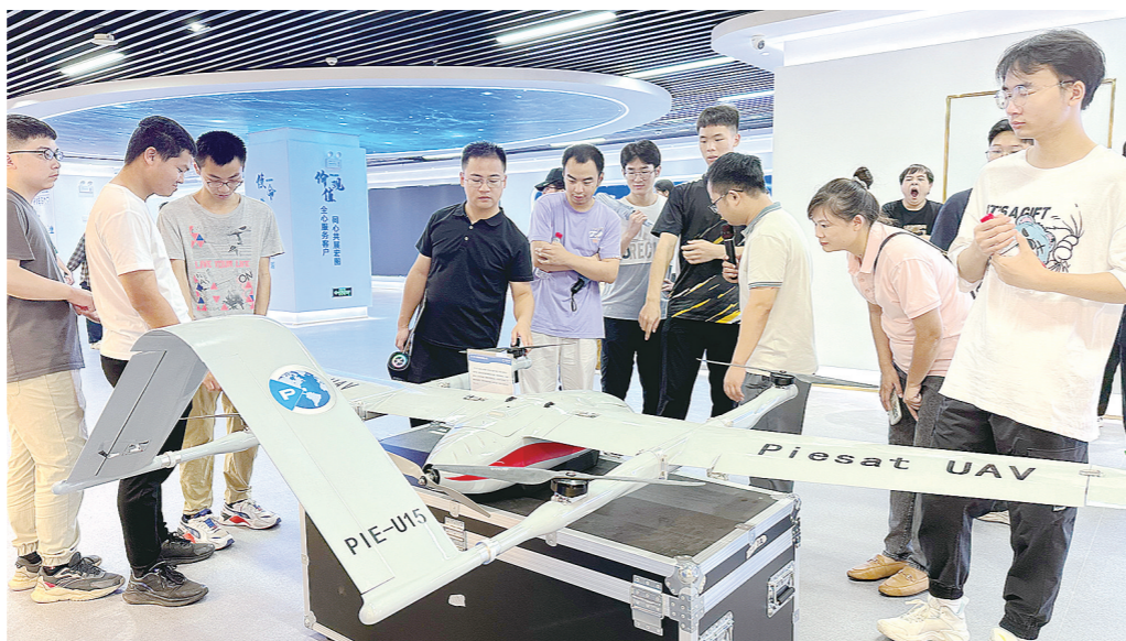
学生们了解“北斗”在无人机上的应用。

“陶瓷、硬质合金……这些株洲的‘拳头产品’,正通过这里,走向全球。”株洲市铜塘湾保