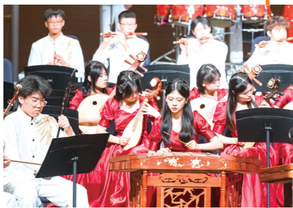
市一中大型原创民族管弦乐曲《古韵湘潮》。

本次艺术作品大赛共收到参赛作品9165幅,创下历年最高纪录。经集中评审,共评出一等奖作品1937幅,二等奖2890幅,三等奖