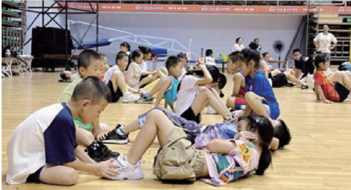
假期余额不足，同学们要坚持锻炼。