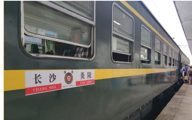
列车运行现场。(资料图)