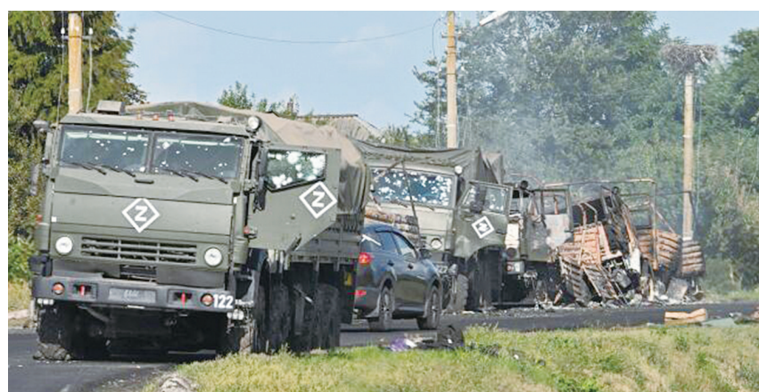
当地时间8月9日，俄罗斯库尔斯克州，俄乌双方战斗持续，一队卡车遭袭。

据美国《福布斯》杂志网站报道，乌方参与作战的是四个机械化旅和一个空中突击旅，其理论总兵力为一万官兵和600辆装甲车，但尚不清楚这些旅是全员