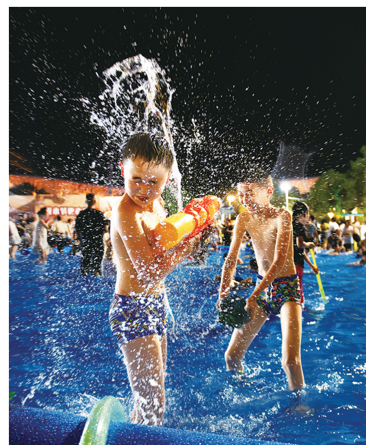
泼水节上的小伙伴。

动感乐 —— 夏夏 文/郑安戈 有奔跑的荷尔蒙,有狂欢的音乐节,有特色小吃,更有嗨翻天的泼水节……这里是欢乐的海洋,这里就是“厂BA”热闹非凡的场外活动! 新华社数次报道,央视名嘴下场解说,湖南卫视当红明星前来助阵,千万级网红追捧,长株潭顶级摄影师云集! 如果时间来到2034年甚至是2044年,时过境迁,驰骋球场的英雄垂暮,呐喊助威的美人迟暮,黄口小儿已长成汉子,此时,我们依然可以在网上,或者到档案馆、图书馆搜索到这些精彩的照片和报纸,去感受这个夏天的沸腾。 这是一个视频的时代,有人说摄影已属于卑微的存在。不是的,一张好的图片可以胜千言,一张被定格的精神瞬间更能激动和抚慰人心,让人铭记。时间会淘汰掉甚嚣尘上的许多动态资讯,而传神的平面图片会作为史料流传。这就是摄影人的光荣与梦想吧!