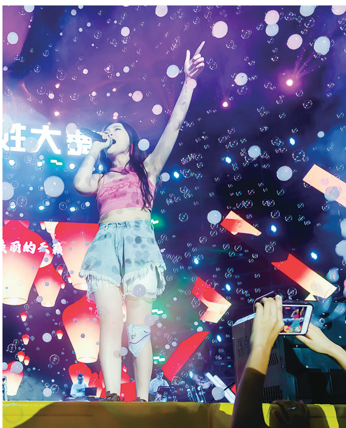
台上慷慨激昂,台下激情互动。

动感乐 —— 夏夏 文/郑安戈 有奔跑的荷尔蒙,有狂欢的音乐节,有特色小吃,更有嗨翻天的泼水节……这里是欢乐的海洋,这里就是“厂BA”热闹非凡的场外活动! 新华社数次报道,央视名嘴下场解说,湖南卫视当红明星前来助阵,千万级网红追捧,长株潭顶级摄影师云集! 如果时间来到2034年甚至是2044年,时过境迁,驰骋球场的英雄垂暮,呐喊助威的美人迟暮,黄口小儿已长成汉子,此时,我们依然可以在网上,或者到档案馆、图书馆搜索到这些精彩的照片和报纸,去感受这个夏天的沸腾。 这是一个视频的时代,有人说摄影已属于卑微的存在。不是的,一张好的图片可以胜千言,一张被定格的精神瞬间更能激动和抚慰人心,让人铭记。时间会淘汰掉甚嚣尘上的许多动态资讯,而传神的平面图片会作为史料流传。这就是摄影人的光荣与梦想吧!