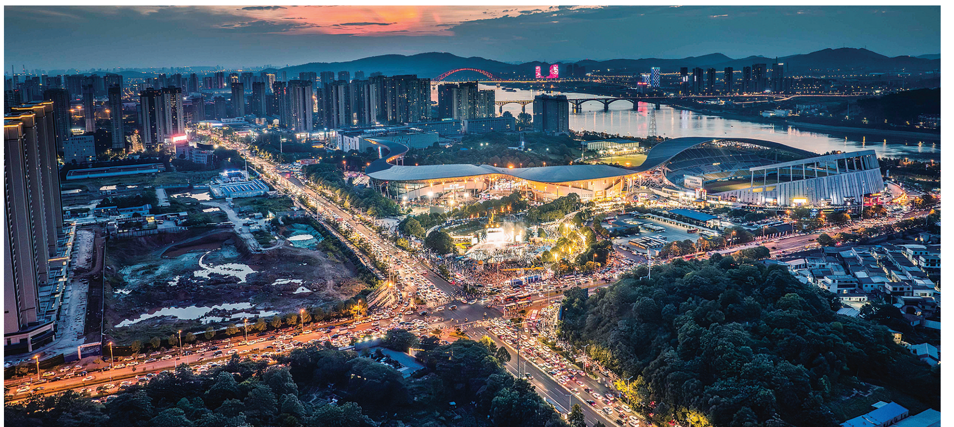
灯火辉煌的“厂BA”现场与晚霞交相辉映。