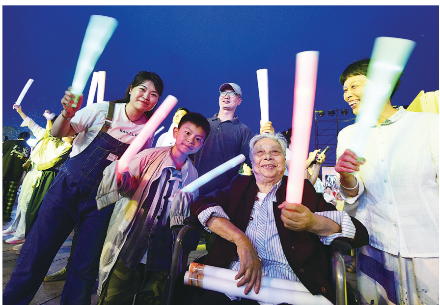
在现场感受“厂BA”气氛的84岁老奶奶。