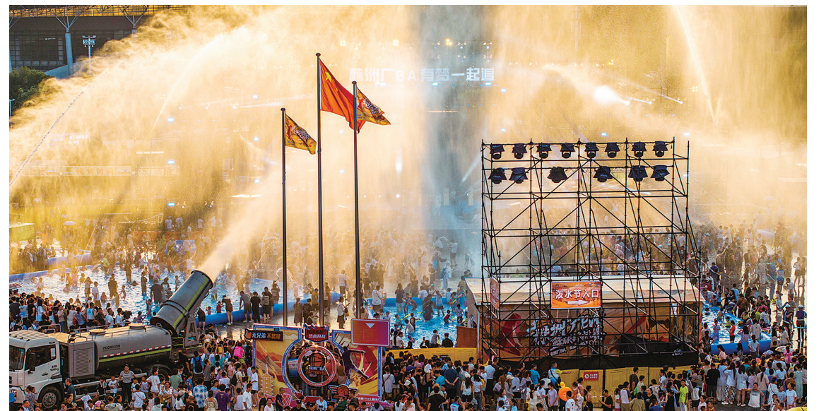
金雾纷飞似幻梦,老少皆欢笑声隆。