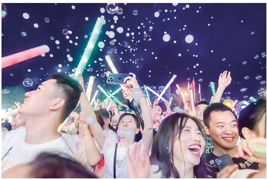
音乐节现场,观众纵情欢笑。