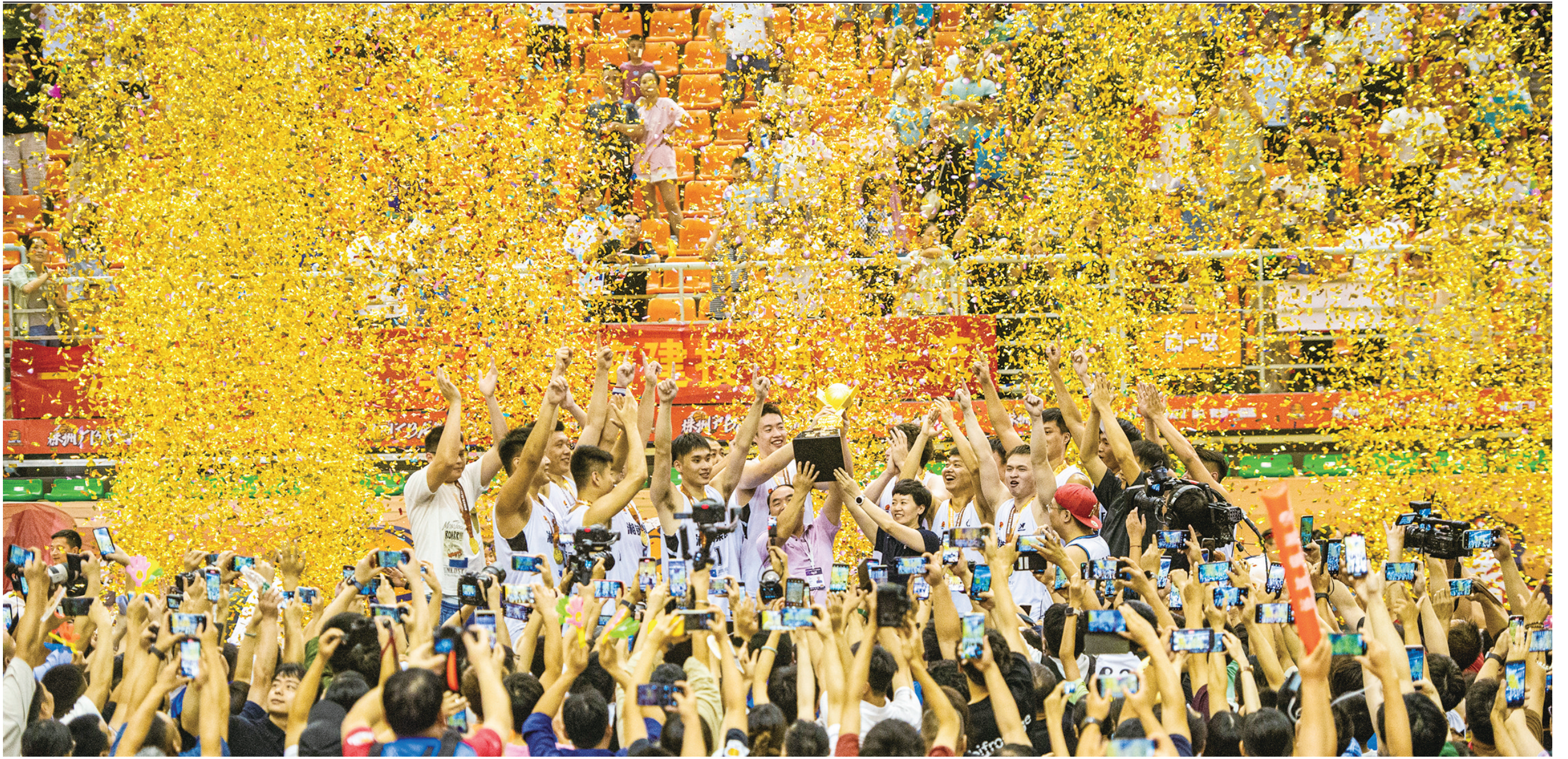
总冠军之夜,“厂BA”成为欢乐的海洋。