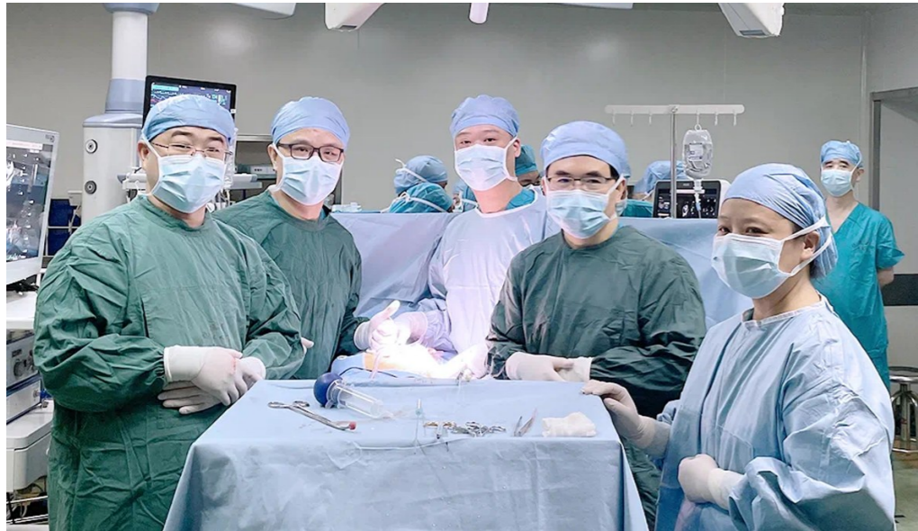
术后合影。

近日，在国际著名心脏病学专家、中国医学科学院阜外医院副院长潘湘斌教授和中南大学湘雅医院心血管外科王霖教授等专家指导下，株洲恺德心血管病医院心血管外科团队成功完成一例经心尖二尖瓣钳夹术，该技术是目前国际上针对心脏瓣膜疾病的微创前沿性治疗方法。