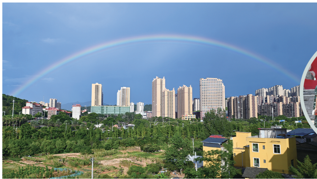
美丽山城宜章,彩虹横空。