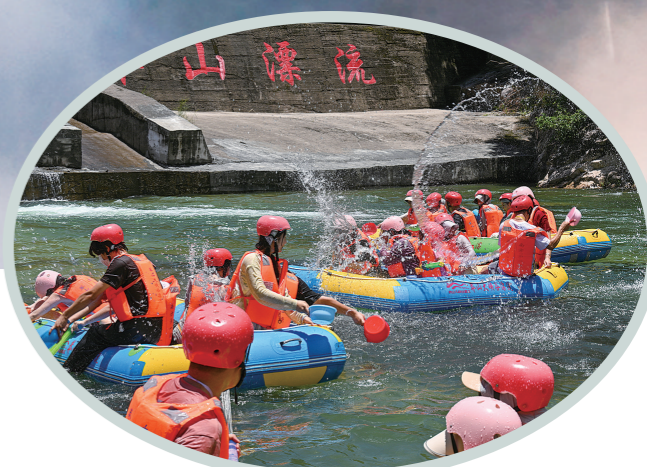
莽山大峡谷的漂流,清凉宜人。