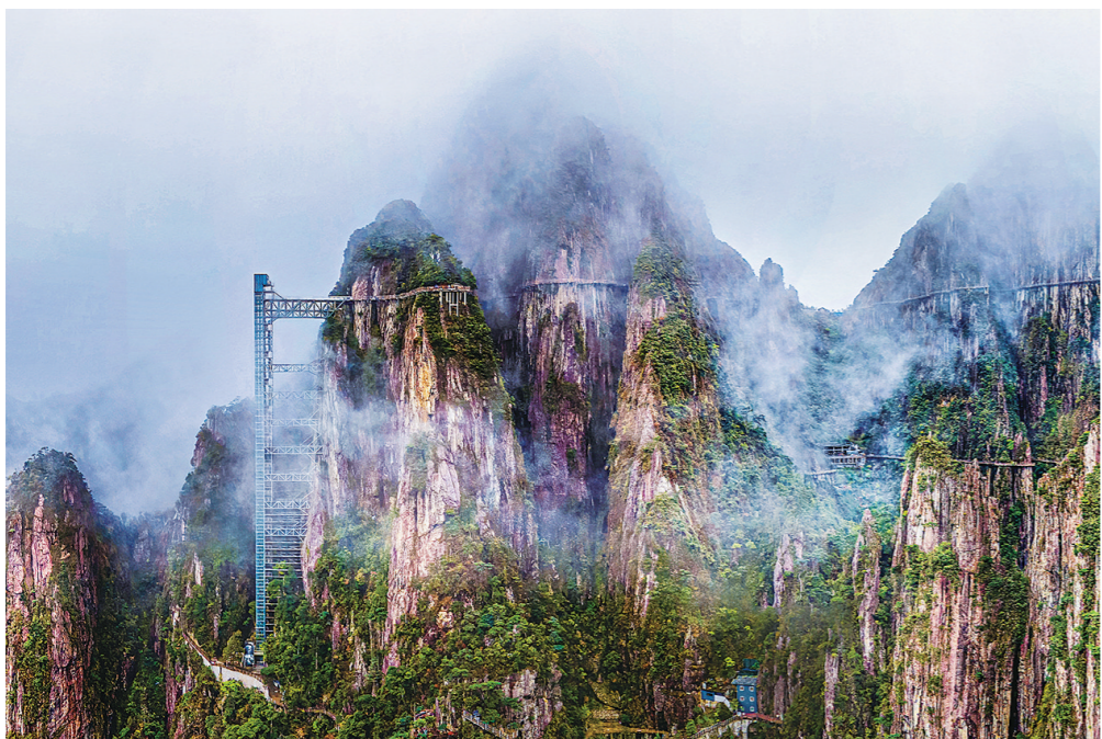
险峻奇幻的莽山国家森林公园。