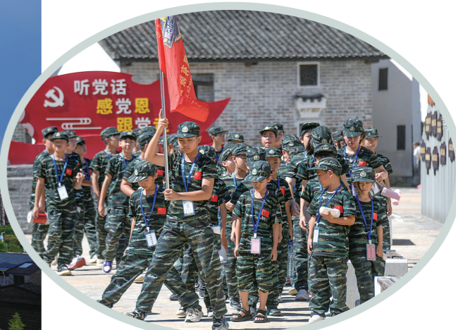
邓中夏故居是革命历史教育基地。