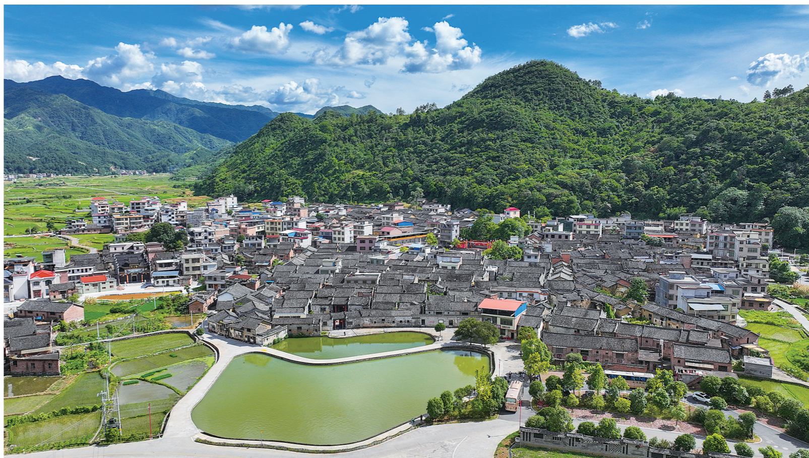
青山环抱的蜡园古村建筑群。