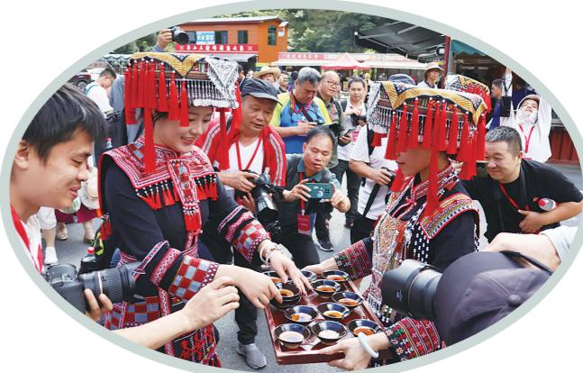
美酒一杯敬来宾。

“镜采宜章,邂逅时光之美”,此次采风活动不仅让记者们用镜头捕捉到了宜章的自然之美和人文之韵,更让他们在心中种下了对这片土地深深的热爱与敬仰。让我们共同期待,未来有更多美好的瞬间在宜章这片热土上绽放,被更多的镜头所记录,被更多的心灵所感知。