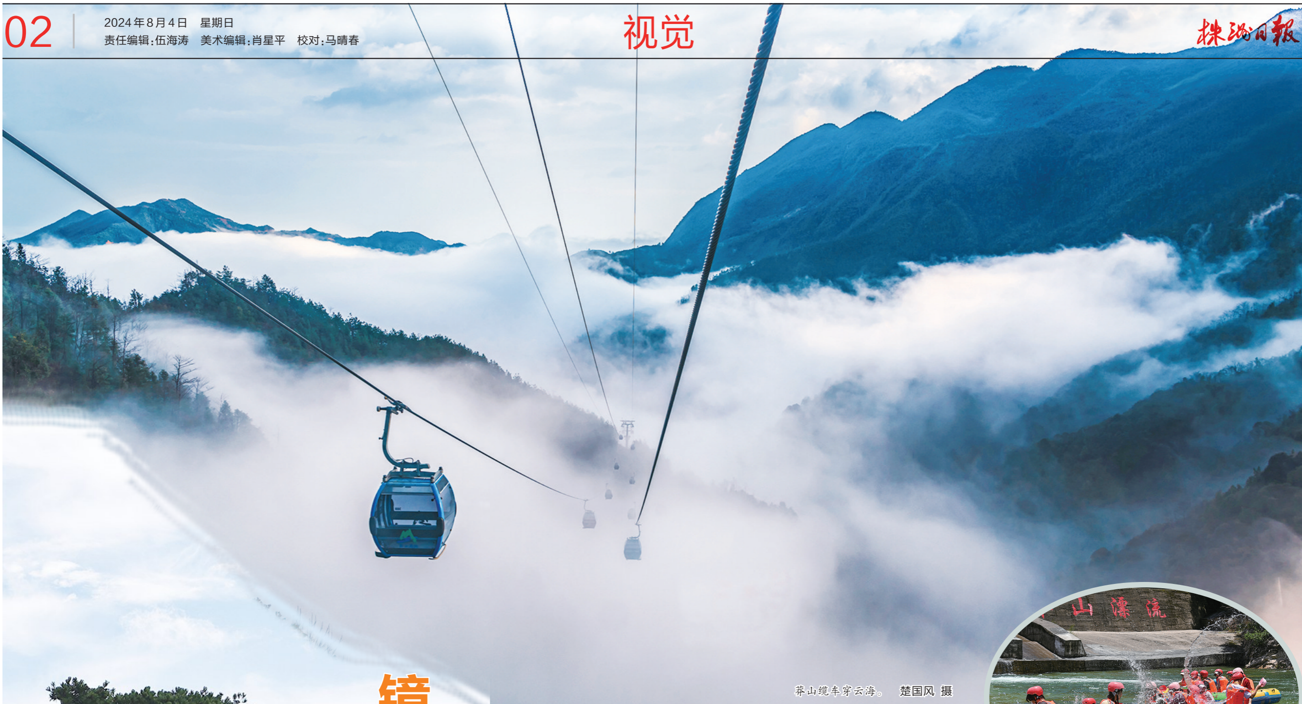
莽山缆车穿云海。