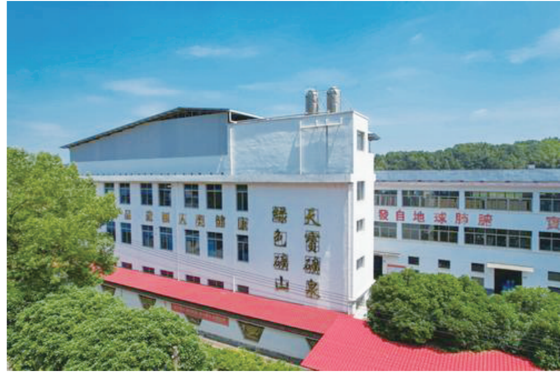
龙洲天宝矿泉水公司厂区

电解质平衡不可或缺的元素;超低钠、低矿化、微量元素含量均衡的特点,使得龙洲天宝矿泉水水质柔软细腻,口感温和纯正。