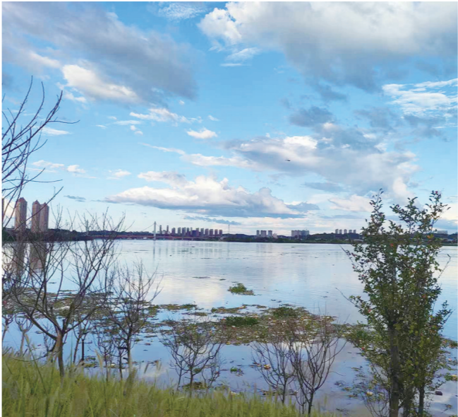
天元区,7月29日下午5:30的湘江。