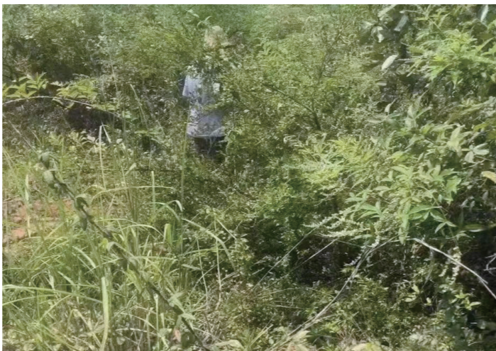
警犬训导员带着警犬“啸天”搜救走失群众。

本报讯(株洲晚报融媒体中心记者/沈全华 通讯员/龚建华)7月25日,茶陵县公安局“汪汪队”成员——警犬“啸天”顶着38℃的高温,沿着气味一路追逐,挽救了一条鲜活的生命。