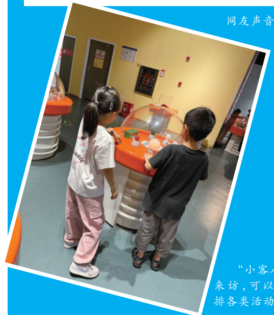
“小客人”来访,可以安排各类活动。