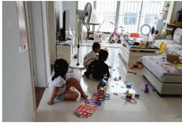
可制定家庭规则,让“小客人”遵守秩序。

暑期到来,不少家庭面临着一个小抉择:如何妥善处理亲戚家孩子来家住的请求?近日,微博上一则“我拒绝了小姑子的女儿来我家”的热门话题,点燃了公众对于亲情与个人空间平衡问题的热议。 今天,我们走进市民的真实生活,聆听他们的心声与故事,共同探讨如何在享受天伦之乐的同时,巧妙地维护家庭的和谐与宁静。