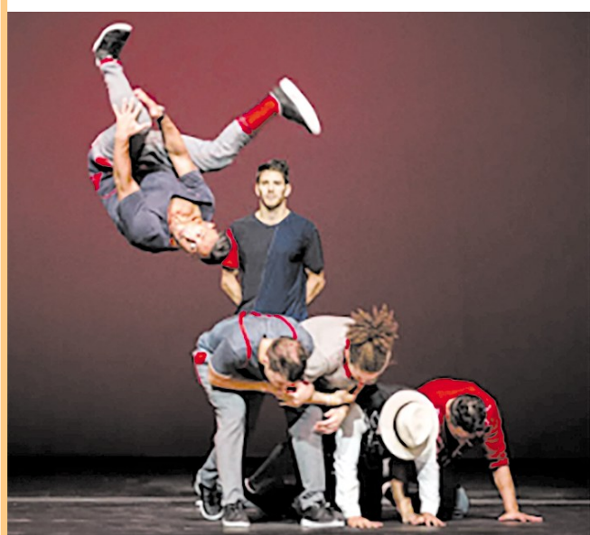
《飞翔的巴赫》现场照片。

《飞翔的巴赫》给观众们带来无尽的快乐。最让我感到新奇的就是投影了，快要结束时，演员们在黑暗中一个接一个的离去，而大屏幕上播放着充满悬念的VCR，很有感染力，整场演出都很有艺术魅力，甚至让人觉得似真似幻。（尹依然）