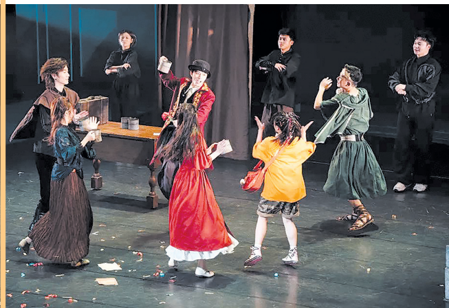
《少年的，莎士比亚奇旅》现场照片。

舞台上，莎士比亚的传奇人生跃然眼前，让观众仿佛穿越时空。此剧不仅是艺术表现与独特视角的杰出典范，更是对人性光辉与文化深度的深刻挖掘，是启迪智慧的文化宝藏。它巧妙地将莎士比亚经典剧作融入其中，使观众在享受视觉盛宴的同时，也经历了一场触及灵魂的心灵洗礼。（易山）