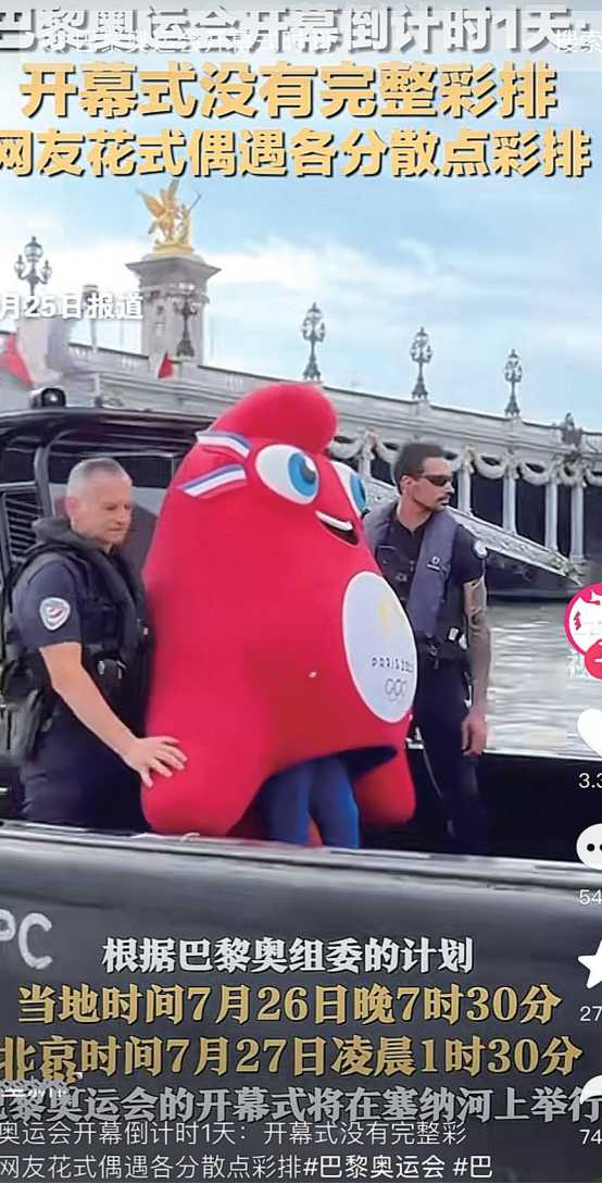
网友花式偶遇各分散点彩排#巴黎奥运会 #巴黎奥运会开幕倒计时1天：开幕式没有完整彩排 网友花式偶遇各分散点彩排