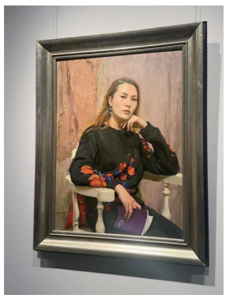
▲贺羽作品《小王的笑脸》。

这次探险,我不仅和大师的画作来了个亲密接触,还学会了怎样用画笔讲故事。满满的收获,让我的心里装满了彩色的梦!