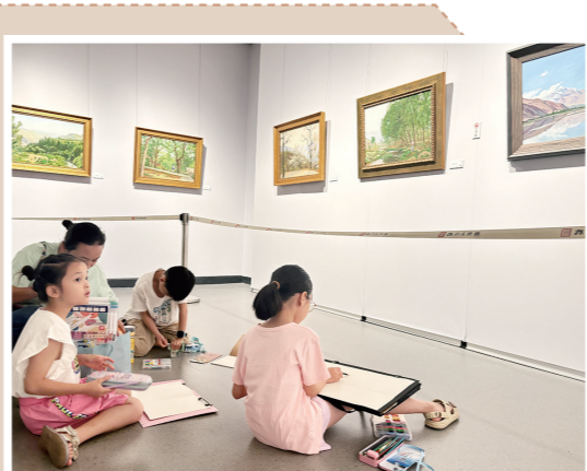
►校园记者进行现场临摹创作。