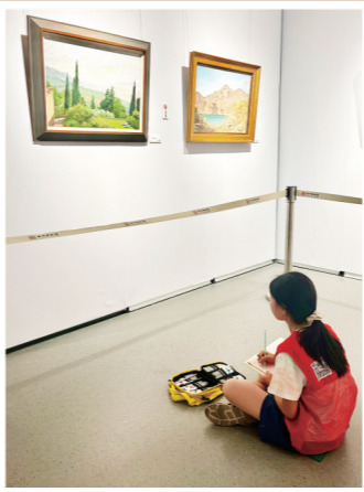
▼株洲日报社校园记者开展看画展、临摹画作的美育实践活动。