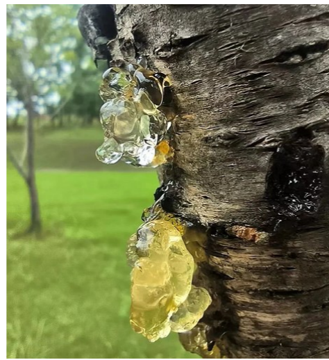
图为树上的胶状物体。

中国数字科技馆曾发布资料称,桃胶美容的说法,并没有科学依据。不过,桃胶也算膳食纤维,对于肠道健康或有帮助,比如方便排便。