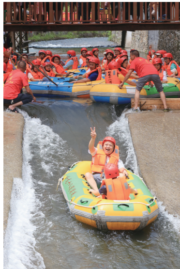
游客体验卧龙村漂流(资料图)。

每天在线及时为您提供法律咨询。 聂炜律师(执业证号:14302200110167458): 13973309857 张倩律师(执业证号:14302201211264263): 18273396450 律师事务所地址:株洲市天元区庐山路323号明峰银座1栋1402