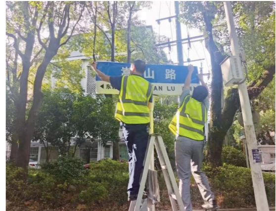
工作人员更换有争议的路牌。

民政局负责人表示,株洲将坚持试点先行、示范引领、全面部署,释放地名工作价值潜力,逐步彰显地名的治理功能、文化特征、经济价值,更好地满足城市建设和发展的需要。