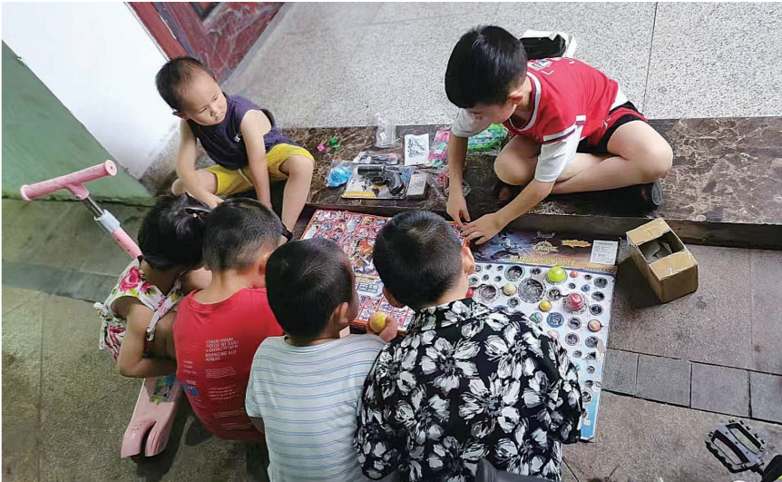
小学生辰辰当起了“摊主”。