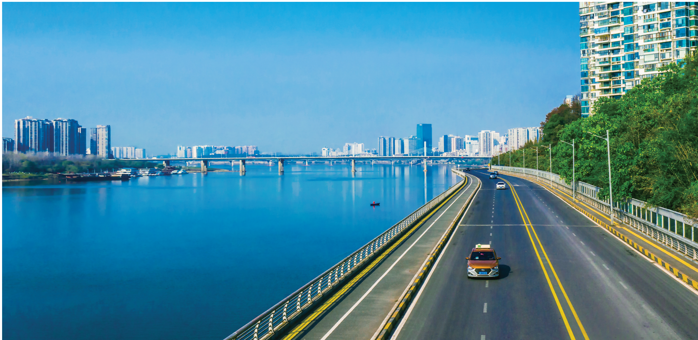
天蓝水美——山水国际小区旁的壮丽湘江。