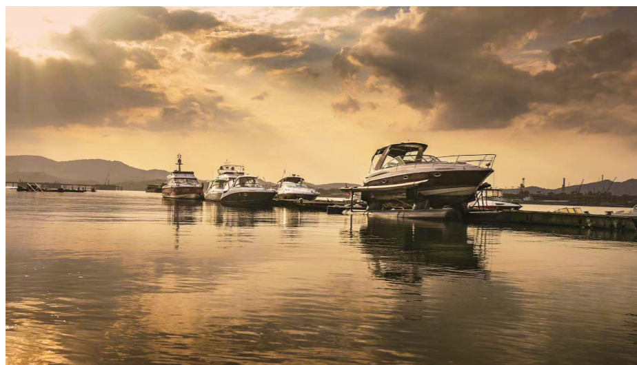
蓄势待发——石峰大桥附近的游艇。