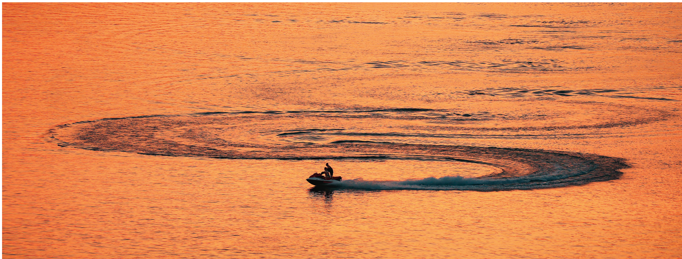
乘风破浪——清水塘大桥俯拍的摩托艇。