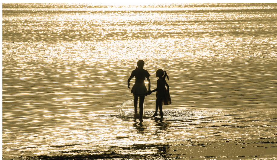
金波荡漾——建宁大桥水畔的戏水儿童。

积小流而成江海,春华潮涌间,帆劲如虹。心慕远方,以兼容并蓄之胸怀,练就更加开放包容之品格,把制造名城、幸福株洲的蔚蓝梦想,渲染得更加波澜壮阔!