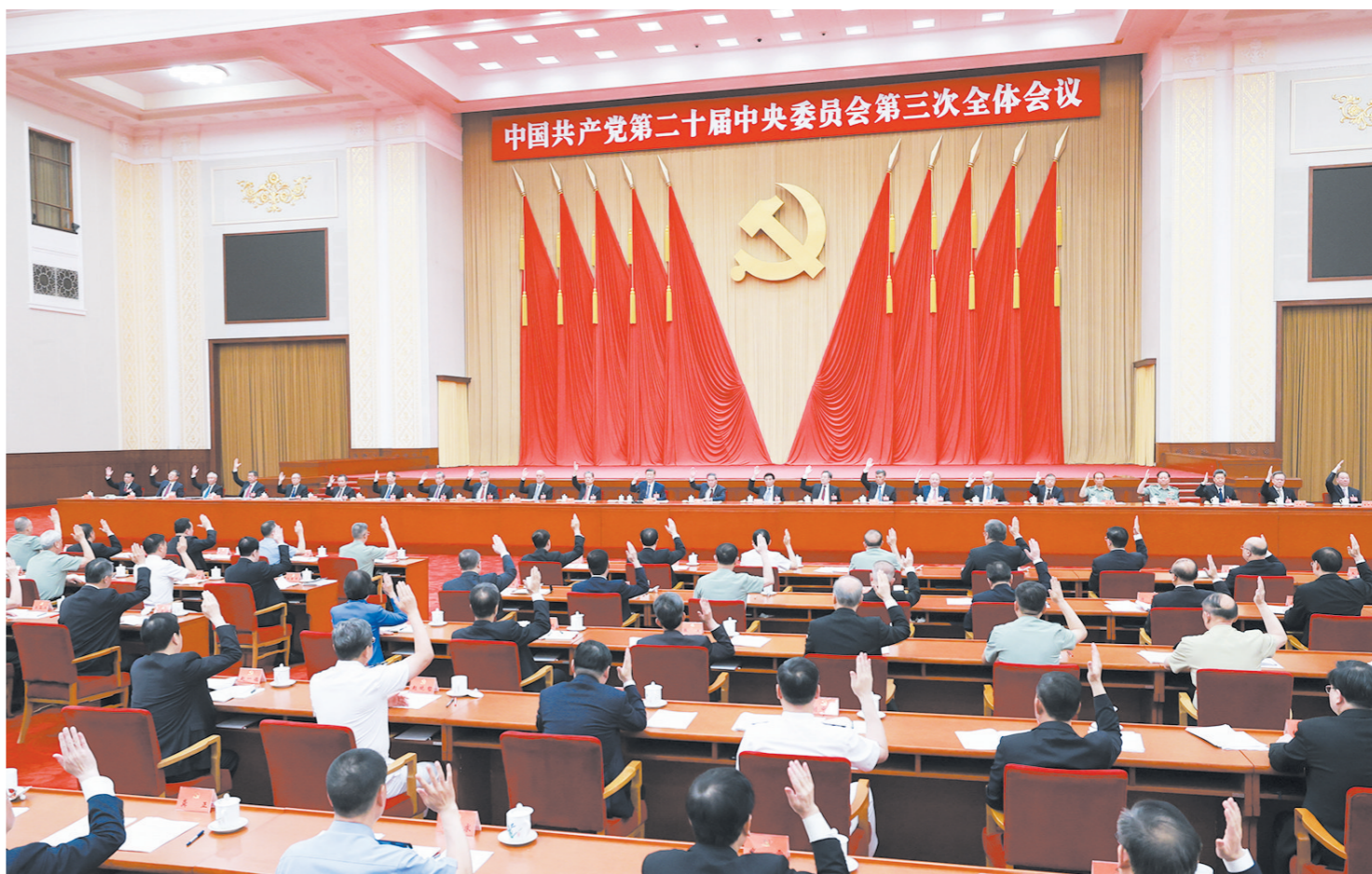
中国共产党第二十届中央委员会第三次全体会议,于2024年7月15日至18日在北京举行。中央政治局主持会议。