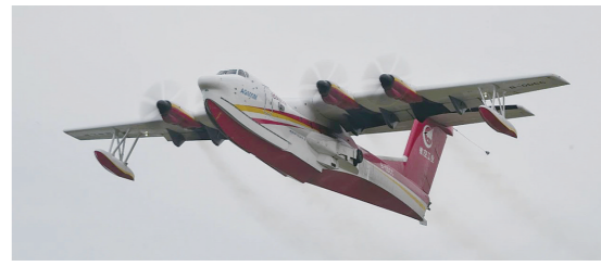
AG600 进行高温高湿飞行试验。

据央视新闻 记者从中国航空工业集团了解到,7月16日,我国自主研制的大型水陆两栖飞机AG600完成了高温高湿飞行试验。