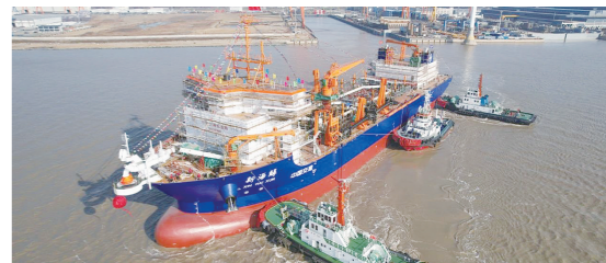
“新海鲟”号出江试航。

据央视新闻 7月17日,在江苏南通和崇明两地海事部门的联合维护下,国内首艘以液化天然气和柴油作为双燃料动力系统的耙吸式挖泥船“新海鲟”号,顺利从江苏启东出江试航。