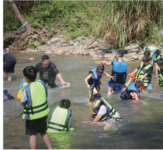
小营员们体验溯溪,感受大自然带来的丝丝凉意。

本报讯(株洲晚报融媒体中心记者/谭筱) 七月盛夏,大雨初歇。一辆载满学员的大巴开进浏阳萤火虫昆虫博物夏令营实践教育基地,一场以“萤光闪烁,探索自然之美”为主题的株洲日报社校园记者夏令营火热进行。