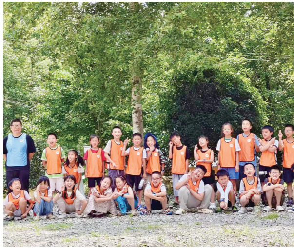
图为参加浏阳萤火虫昆虫博物夏令营活动的学生们合影留念。