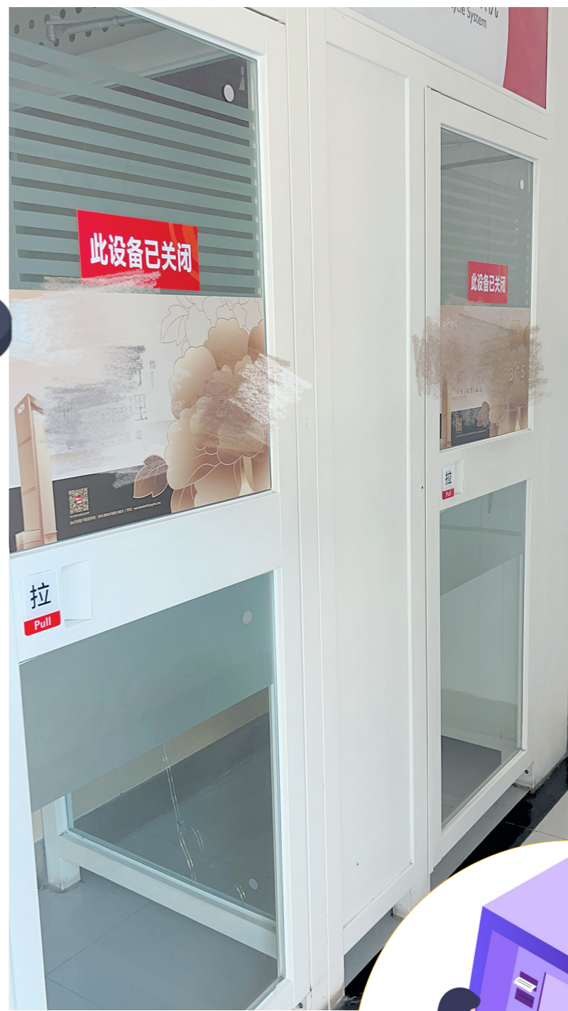
▲某银行的自助服务区,部分ATM机已暂停使用。

这份“招募令”,既是面向制造业企业,也是面向工业服务型企业在,在供需双方间搭好合作平台。收好这份有关智能制造的“清单”,株洲机遇正虚席以待。