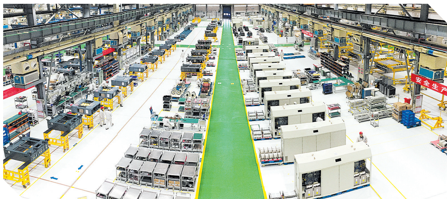
中车株洲所时代电气制造中心。

此外,还有银行在 ATM 机上引入人脸识别、扫码功能,允许客户通过“刷脸”“扫码”完成存取款操作;也有银行将 ATM 机的功能扩展至转账、缴费、货币兑换、投资理财咨询等多个领域,使其成为银行服务的多功能自助终端。