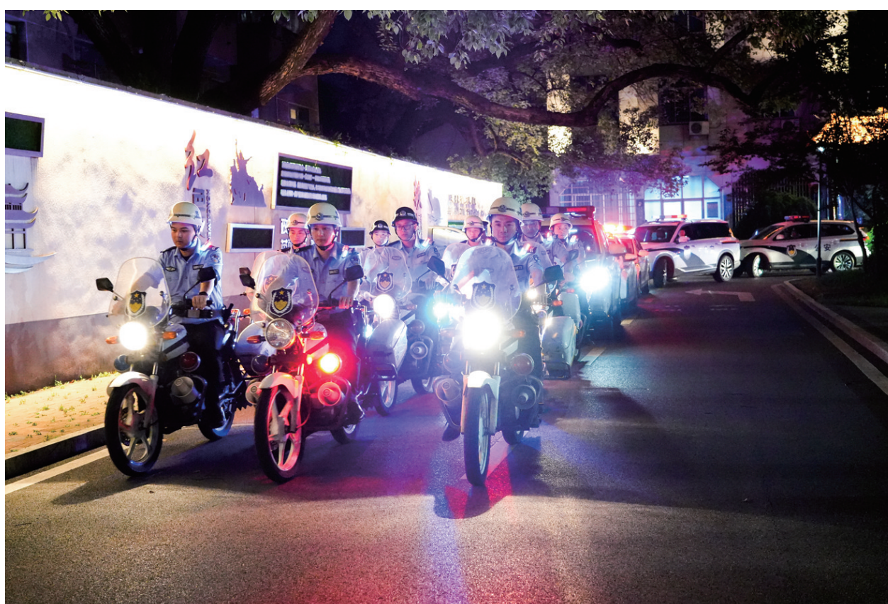
铁骑巡逻守护。