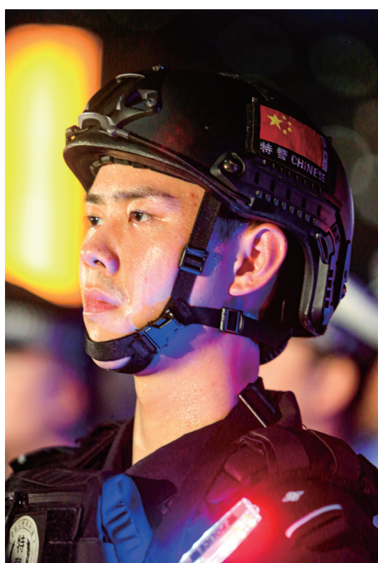
特警武装戒备。

出违法犯罪及交通安全、消防安全、安全生产等领域风险隐患,聚焦商圈、景区、夜市等重点区域,水电油气、娱乐、洗浴、出租屋等重点场所,“厂BA”、航交会等重大活动,开展地毯式巡查宣防,最大精度凝聚打击锋芒,最大限度激发巡防合力,最大限度挤压犯罪空间,切实筑牢夏季“防护墙”,当好平安“守夜人”。