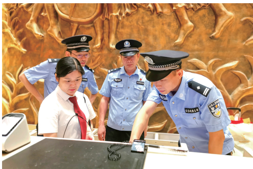
实名制登记检查。