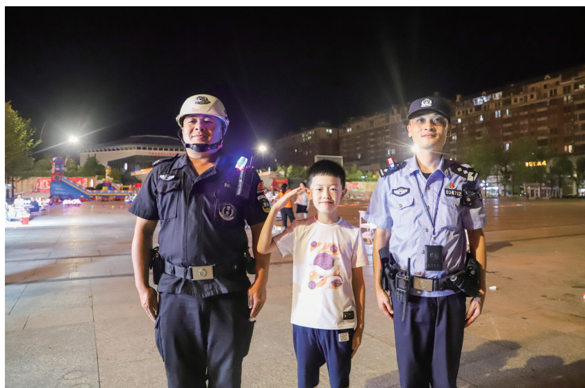
“警察叔叔,辛苦了!”