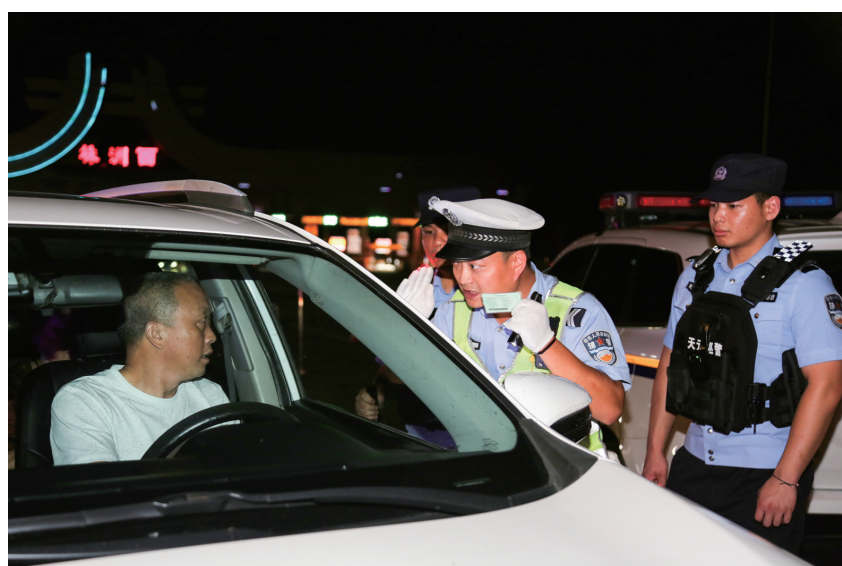
路面安全检查。