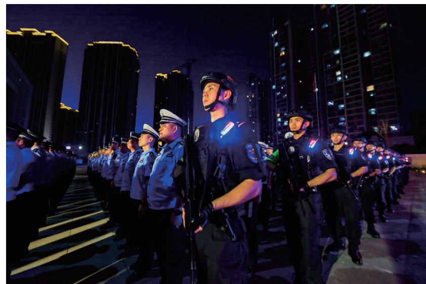
整装待发。