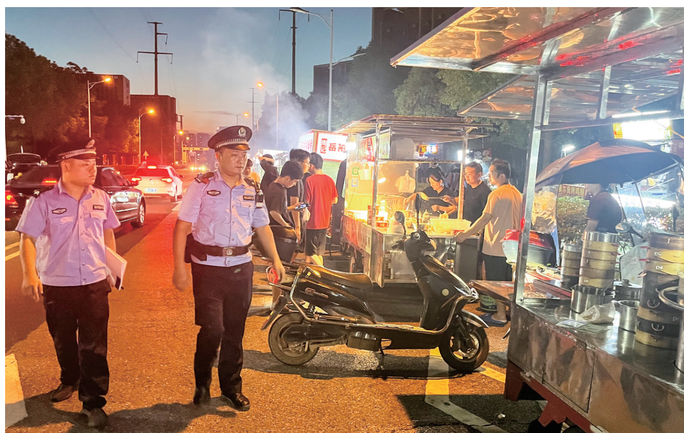
徒步巡逻宣防。