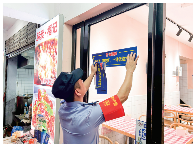
安全教育宣传。