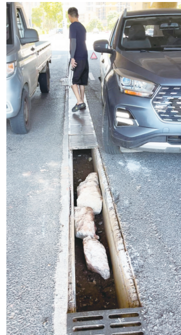
记者从路边搬来水泥块“填水沟”，助车主摆脱困境。