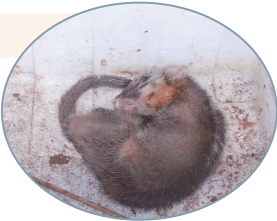
受伤的小鼬獾。

受伤的野生动物,请不要擅自上前去救助,以免发生意外。要及时拨打110,待民警及专业的救助人员前去救助。同时,不要擅自放生各类野生动物,避免破坏当地生态环境。对猎捕、贩卖、运输、食用各类野生动物及其制品等违法犯罪行为,公安机关将予以严厉打击。