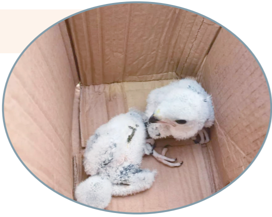
采菊的小雀鹰。

据了解,雀鹰为鹰科、鹰属的鸟类,体重130克-300克;体长310毫米-410毫米,翼展60厘米-75厘米。雄鸟头、背青灰色,眉纹白色,喉布满褐色纵纹,下体具细密的红褐色横斑;雌鸟上体灰褐色,头后杂有少