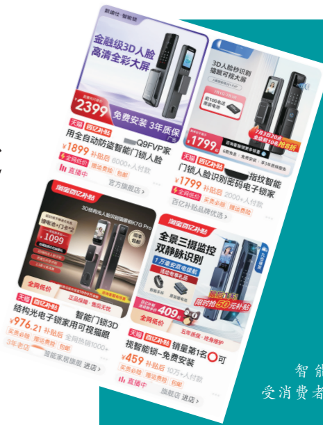
智能门锁 受消费者青睐。