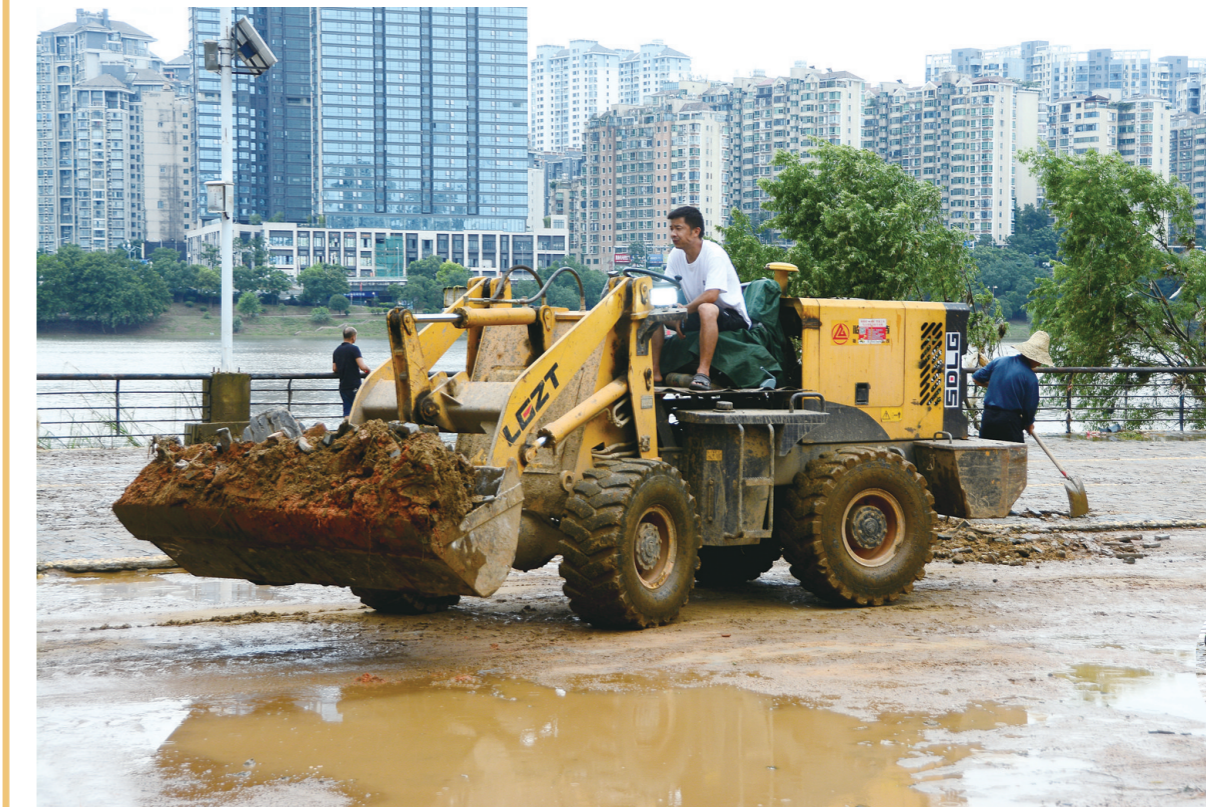
洪水过后的湘江风光带污泥、垃圾堆积,工作人员正在全力清污。

本报讯(株洲晚报融媒体记者/伍靖雯) 连续强降雨过后,市城管系统迅速组织开展雨后清污、设施检修和管网疏浚等工作,以最快速度修复市容环境,还市民一个靓丽整洁的城市环境。