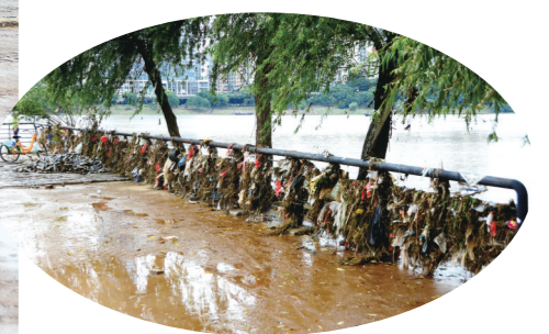
布满垃圾的栏杆。

在天伦西路沿线,环卫工人趁着雨后天晴,对沿线的人行道开展一轮冲洗,并对城区垃圾容器、休闲座椅进行擦拭冲洗,确保雨后道路见底色、设施洁净如新。