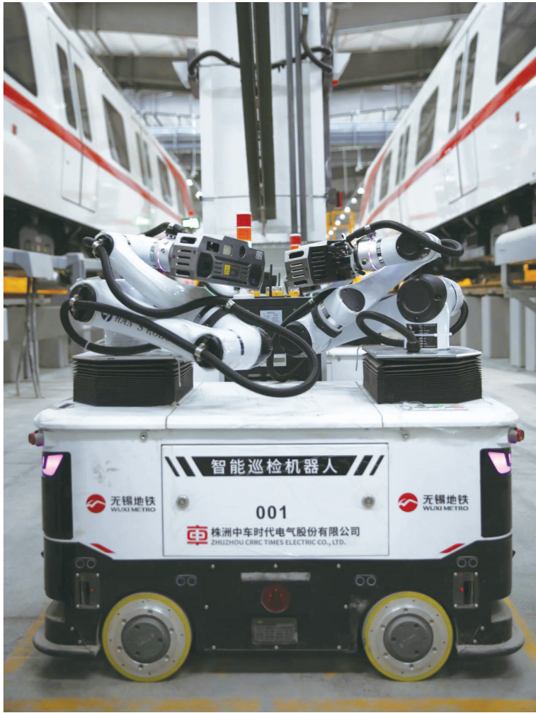
中车株洲所的智能列检机器人每天都在为无锡 S1 线开展巡检。