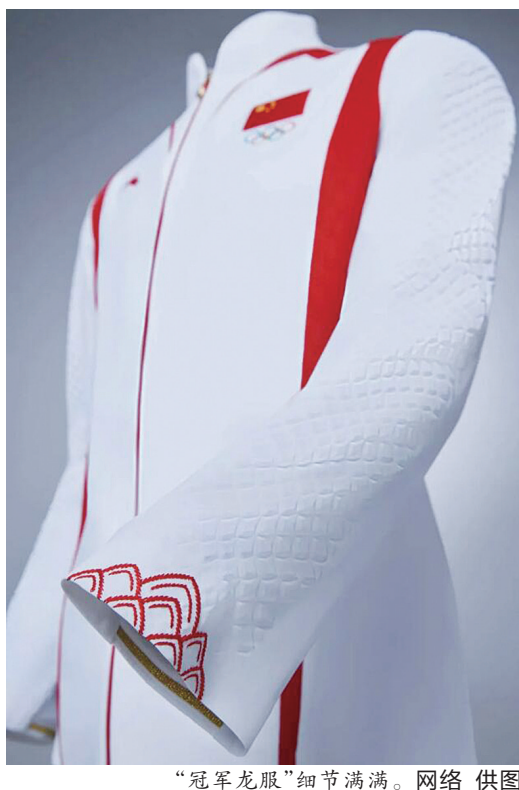
“冠军龙服”细节满满。

据央视新闻 巴黎奥运会开幕在即，中国体育代表团领奖服25日在北京发布。领奖服延续“冠军龙服”的设计，传承经典中式版型与留白主色调，将“龙鳞”“龙须”等元素与压花纹样、拼接、刺绣等工艺相结合，向世界传达中国传统文化底蕴的同时，展现新时代中国运动员拼搏进取、朝气蓬勃的精神面貌。中国运动员在巴黎奥运会赛场夺得奖牌后，将身着这套领奖服登上领奖台，展示中国体育健儿形象。据了解，巴黎奥运会中国体育代表团领奖装备以环保再生纤维打造而成，在生产过程中通过使用再生尼龙、再生涤纶等环保面料，有助于减少碳排放，其中领奖服实现超过50%的碳减排，是中国首套经权威机构认证的碳中和奥运领奖装备。2012年中国龙年，“龙”元素首次融入中国体育代表团领奖服设计，“中国龙”的足迹遍布伦敦、索契、里约、平昌、东京和北京的奥运赛场。