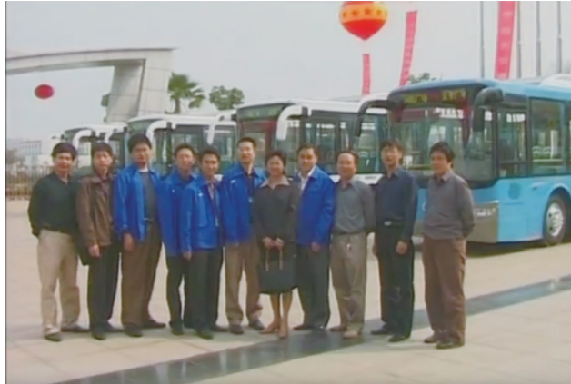
示范线路开通当天中车电动团队合影留念。

谁都没想到,23年前,新能源汽车能够在株洲这座小城里开花结果。更没想到的是,新能源汽车的小小“种子”落地株洲10年后,株洲不仅成为全国首个电动汽车公交城市,也让新能源汽车产业在这里落地生根、茁壮成长。 2004年10月,中车时代电动汽车股份有限公司敢为人先,在株洲试点新能源公交,并开通了全国第二条、湖南省首条节能与新能源汽车示范运营线。在它运营的这些年里,不仅逐步为株洲市几乎所有的公交车切掉了“黑尾巴”,也为株洲新能源汽车产业的培育和壮大播下了希望的种子。