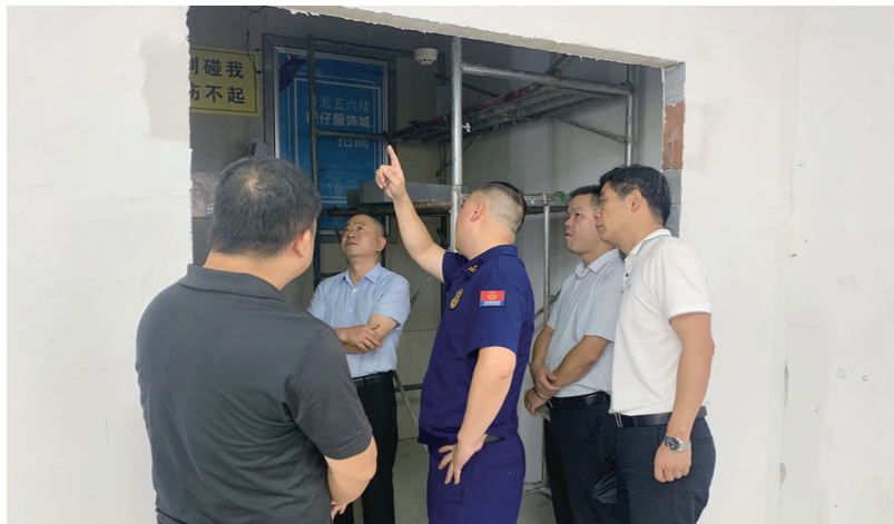
代表们现场检查芦淞市场、淞南市场消防安全情况 通讯员供图

本报讯(株洲晚报融媒体中心/杨凌霄 通讯员/殷睿斯) 6月19日,芦淞区人大代表建宁团结合芦淞区人大常委会组织的五级人大代表“我为民、我履职、我行动”活动,开展芦淞市场群消防隐患整改监督检查。建宁街道办事处、市场服务中心、消防大队相关负责人参加督查。 芦淞市场群是中南地区最大的服装批发市场,流动人口密集。现有各类专业市场38个,2.28万个商铺,从业人员超10万人,汇聚各民族商户及从业人员1100余人。这里消防安全形势复杂,一直以来都是株洲市防范火灾风险的重中之重。 代表们现场察看了芦淞市场、淞南市场消防安