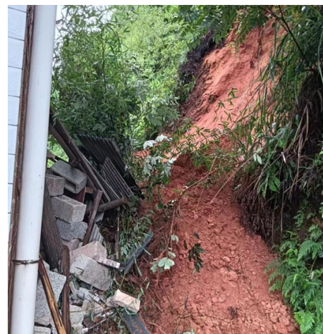
王改平家山体滑坡现场。

市气象台统计,6月15日至19日,株洲进入降雨集中期,强降水频繁。此期间,全市普降暴雨到大暴雨,平均降雨量100.3毫米。在此之前,市气象局共发布预警信号45次,发布《气象专题报告》2期,《气象信息快报》8期,递进式预警服务已全面融入株洲防汛抗灾应急响应工作流程,构筑起多维立体气象防灾减灾服务体系。