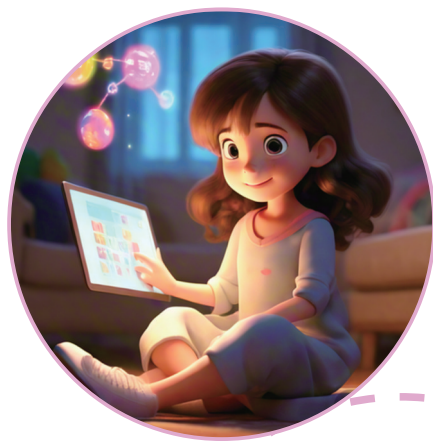
记者30秒内制作的AI图片。