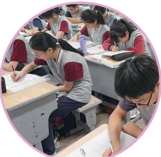
防止AI成为学生“作业偷懒神器”。

记者发现,在网络上,一些家长也鼓励孩子使用AI来写作文,并在网上分享AI如何提高孩子的写作水平。有网友发帖表示,通过AI的帮助,孩子能够获得更多的好词好句,经过AI润色的作文也得到了老师的高度评价。他们认为,早点使用AI,早点学会与智能设备相处,是对未来的一种准备。