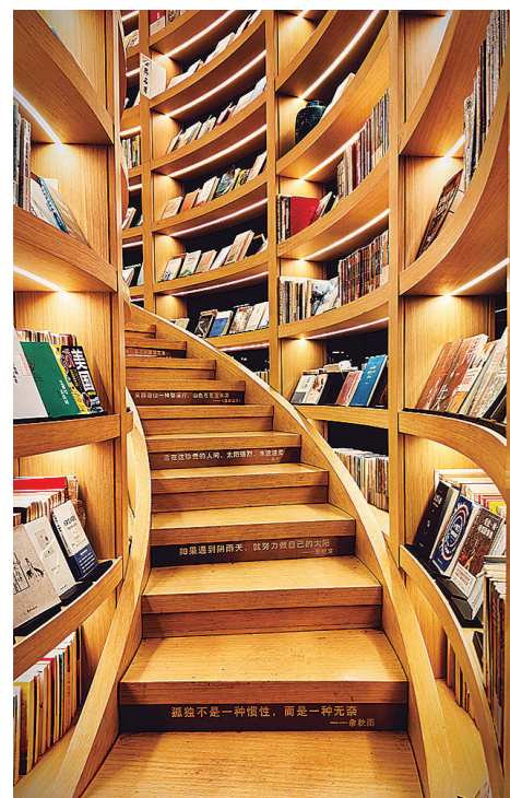
《步步高升》(廖辉/拍摄剪辑班)