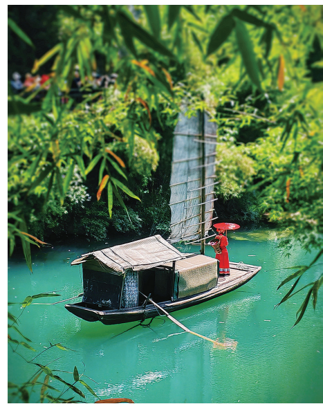
《小舟撑出柳阴来》(李红辉/短视频制作班)