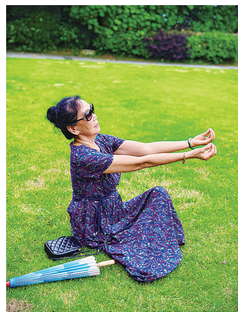
《你最珍贵》(徐进佳/拍摄剪辑班)