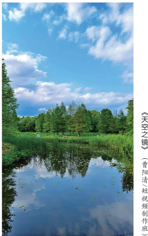
《天空之镜》(曹阳清/短视频制作班)