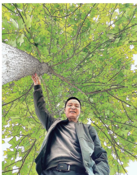
《遮风避雨》(李滨/短视频制作班)