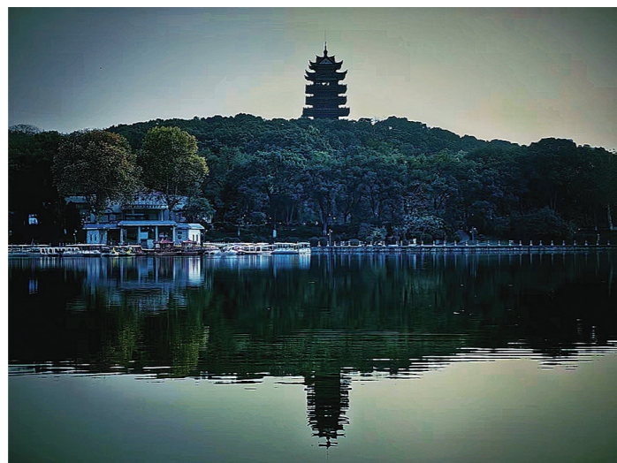
《天然水墨画》(王冬秀/拍摄剪辑班)