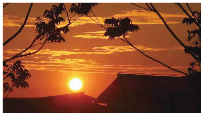
《落日中的剪影》(严凤兰/拍摄剪辑班)