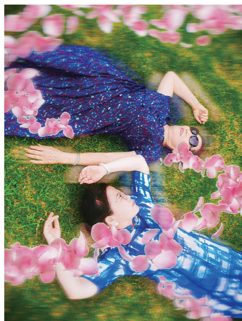
《享受生活》(汪春萍/拍摄剪辑班)