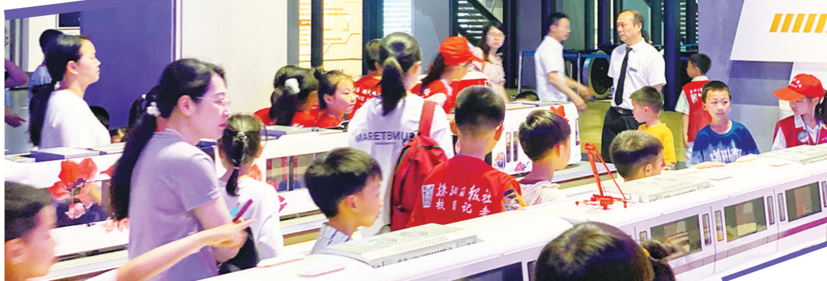
▲学生们近距离感受家乡工业魅力与活力。

工业游,就是让更多普通老百姓特别是中小学生们能够了解这个生产加工过程,株洲日报社校团记者去芦淞区航空工业小镇参观过,了解飞机生产过程并体验模拟飞行等趣味活动,这就是一次工业研学旅游。