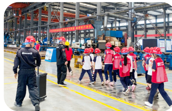
▲校园记者参与工业研学游。