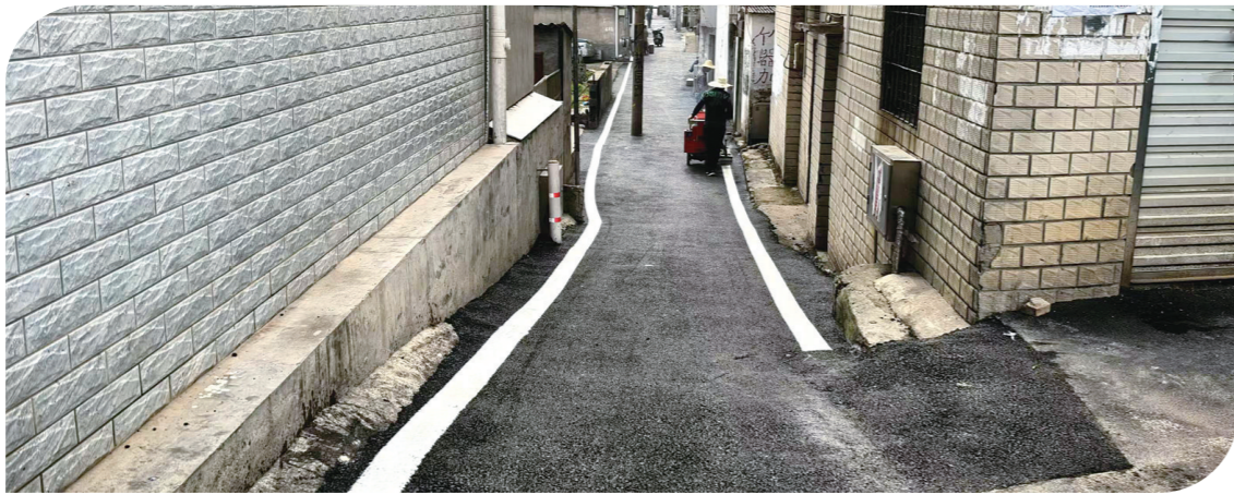
龙泉村万金牌路重新铺上沥青。

凝聚各方力量,充分发挥基层党组织的战斗堡垒作用,龙泉街道打出拆、建、治等系列“组合拳”,全力推动龙泉村焕发新颜。例如,在龙泉村开展“最美庭院”卫生评比,并上门挂牌,实行党员划分责任区、村民代表联系群众、邻长包户,发动党员群众清理公共