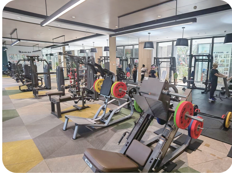
健身开始融入市民朋友日常生活