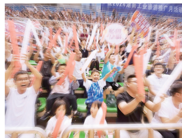
▲六一国际儿童节那天,孩子们来到现场,为选手们加油助威!

这场篮球赛,包含了人们对美好生活的期待,它吸引着越来越多的运动者在运动中挥洒汗水,在厂矿文化中,感受生活的快乐。