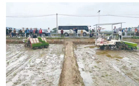
▲无人驾驶插秧机和水直播机同时在高标准农田作业。