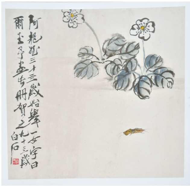
齐白石为胡家作的第九幅画作《草花小虫》

滚滚红尘，多少的怨偶耳鬓厮磨相守，柴米油盐相伴，仅仅是为了在精神死去之后，满足肉身存续之需，不得已委曲求全。命该如此，身心两难全。想当初，张爱玲是否也曾有过俗愿：不嫌隙隙，愿与君相安，共续岁月静好？不得而知。