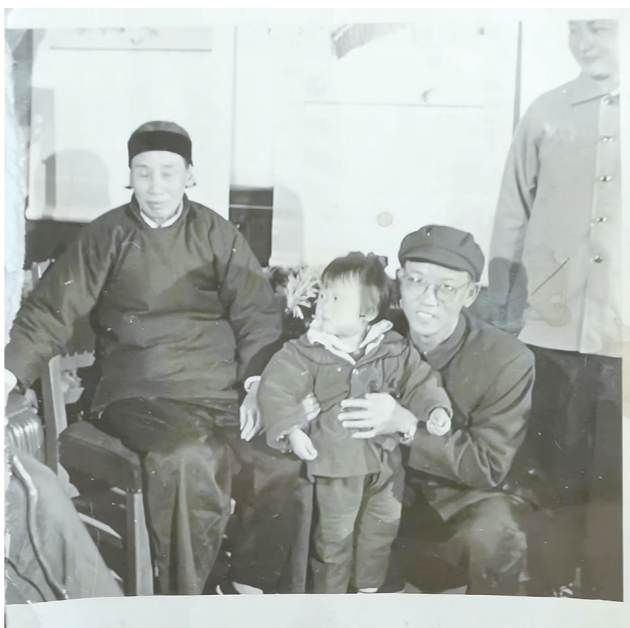
齐白石与胡光莹一家的合影残照