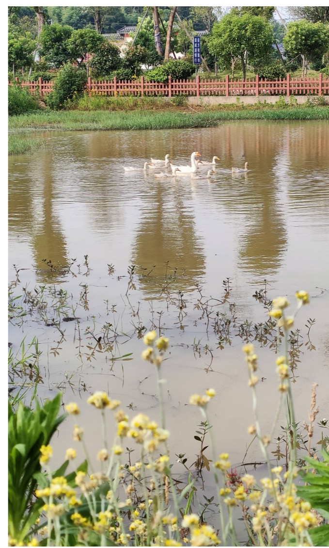
天元区群丰新塘村的田园风光。