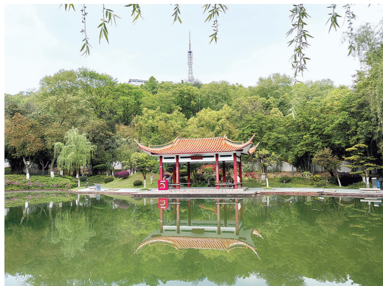
满园春色关不住 (李又荣)