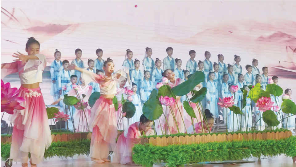
演出现场

本报讯(株洲晚报融媒体记者/孙晓静 通讯员/朱梦露) 5月28日,“咱们教育有力量”石峰区第八屆中小学生艺术展演暨“新时代好少年”颁奖典礼在石峰区长郡云龙实验学校举行,来自全区20余所学校的师生为在场观众献上了一场精彩的演出。 本次艺术展演分为少年美、少年志、少年强3个篇章。朗诵《四季诗韵》、舞蹈《玉兰