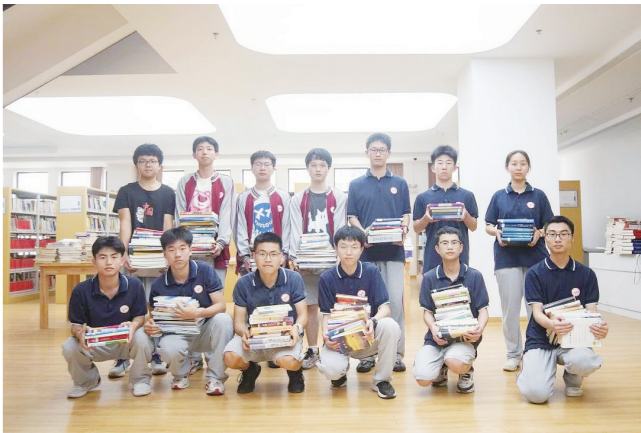
学生将赠书送到校图书馆。

本报讯(株洲晚报融媒体记者/戴凇 通讯员/杨斯琦) 5月27日,株洲市南方中学高三年级学生举办了一场温馨而有意义的赠书活动。高三学子们把陪伴了自己多年的课外书籍,作为一份珍贵的礼物送给母校图书馆,让书籍在共享中实现价值最大化。 当天,高三年级20个班级的代表,搬着精心整理的书籍走进图书馆,井然有序地进行登记、捐赠。这些书籍承载着高三学子们的青春记忆,镌刻着他们奋斗的足迹。 学生代表说,希望这些书籍能在学弟学妹们的手中发挥余热,让更多的同学从书中受益。 据悉,此次捐赠的书籍经整理后,将被放入学校的公共阅览室、图书角等地,让温暖和书香洒满校园。 通过此次赠书活动,高三学子用真挚的情感撑起了一座知识的桥梁,展现了高三学子对母校的感恩之情,对学弟学妹们的关爱之情,同时也传递了奉献、友爱、互助、环保的文明风尚。