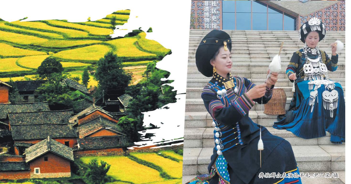
彝族群众表演捻羊毛