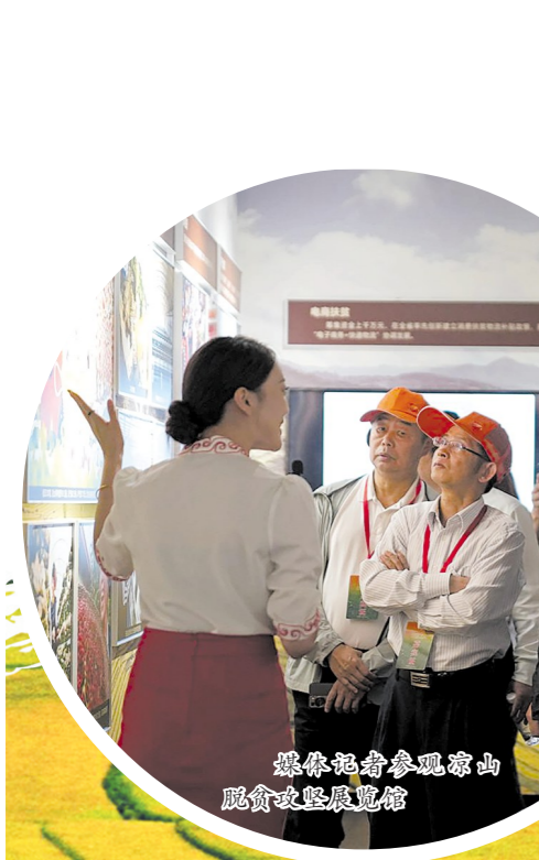
媒体记者参观凉山脱贫攻坚展览馆