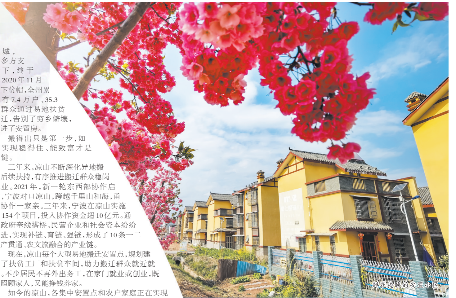
绿花绽放的安置小区