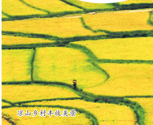
凉山乡村丰收美景