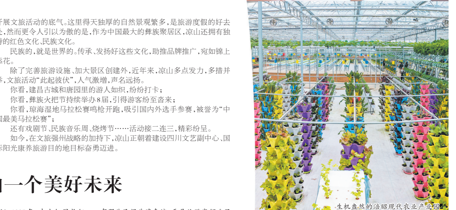
生机盎然的昭觉现代农业产业园