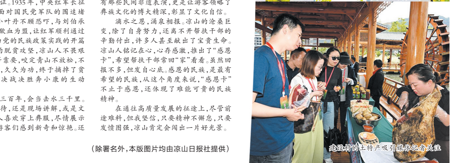
建昌州的土特产吸引媒体记者参观