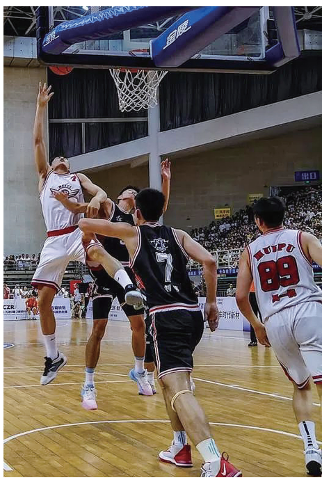
时光不同，但快乐相同。图为株化篮球比赛老照片与去年“厂BA”精彩瞬间。