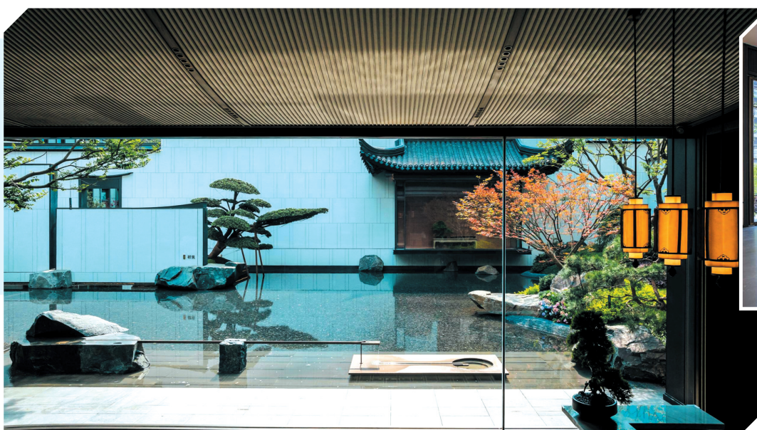
建发缦云实景图。通讯员 供图