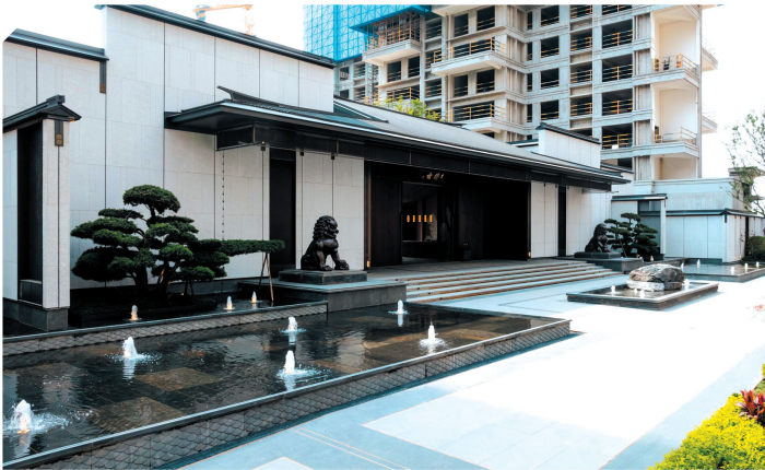
建发缦云售楼中心外景。

据介绍，此次全新禅境中式新产品——建发缦云，是建发房产的高端住宅产品，专门针对改善客户打造标杆系列作品，目前只在上海、杭州、广州、成都、长沙等城落地。而在设计文案成型之前，建发房产在株洲经过3年的沉淀，设计团队梳理了超2000户株洲建发央著业主的需求，打磨方案超1年时间，这才有了超越前期的产品面世。