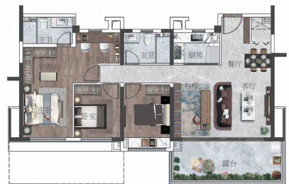
120平方米户型图（偶数层）。

在这样的户型设计中，更令人惊艳的莫过于那个巨大的鱼缸了，把鲨鱼搬进样板间，足以说明户型尺度的阔卓，户户空中大露台的设计，更是市场少见的配置。