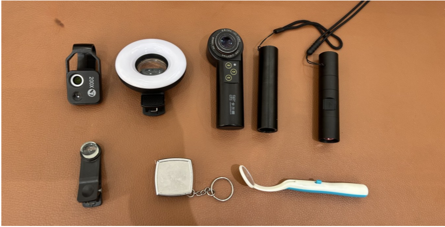
鉴定师的鉴定工具。