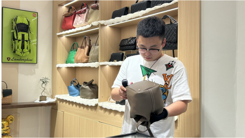
奢侈品二手交易中心鉴定师正在检查包包。