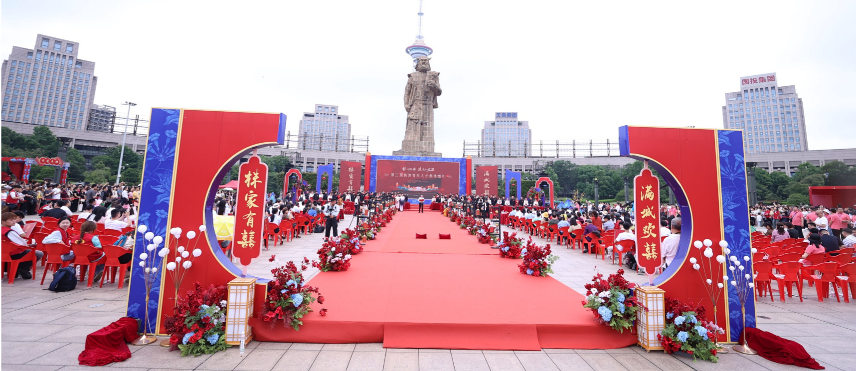
▲株洲市第三届青年人才集体婚礼现场。

5月20日，株洲市第三届青年人才集体婚礼如期而至。在神农城广场，全城共同见证50对新人的幸福时刻。集体婚礼通过直播平台、微信等各种形式发布后，引发全城点赞。众多“围观”网友感叹：“这场集体婚礼真把我震撼到了”“这应该是他们一辈子都难忘的记忆吧”“太有意义了，可惜我没赶上。”