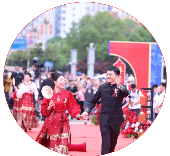
▲新人共同跨马鞍，寓意平安（鞍）幸福。

位置。“新人才30条”“支持青年科技人才发展的六条措施”、人才住房补贴等49项人才政策先后实施；“制造名城进名校”系列活动年年开展，市领导带队赴北京、武汉等大城市招才引智；举办厂BA、航空嘉年华、马拉松等各类活动，激发年轻人的活力……可以说礼遇青年人才，株洲“礼”在平常。正是株洲的热情包容，吸引了越来越多的年轻人，愿意成为株洲的