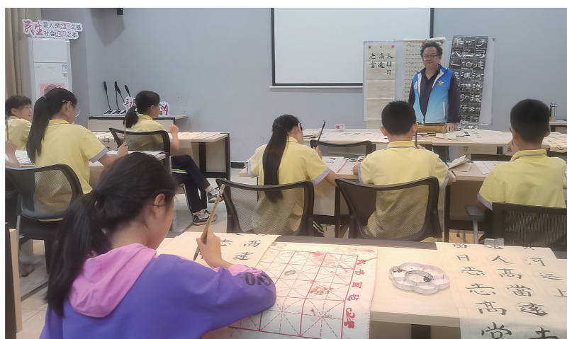
我作为晚报老年大学“志愿者”，在天元区社区学院辅导学生书法。 资料图