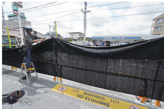
5月21日,工人搭建“隔离网”遮挡富士山景。

日本富士山北麓一座小镇是各国游客热衷打卡的“网红”景点,但“人气”过旺反而让当地居民不堪其扰,终于促使当地政府在今年登山季来临前采取行动,拉起一道“黑网”将山景屏蔽,以阻挡游客聚集拍照。